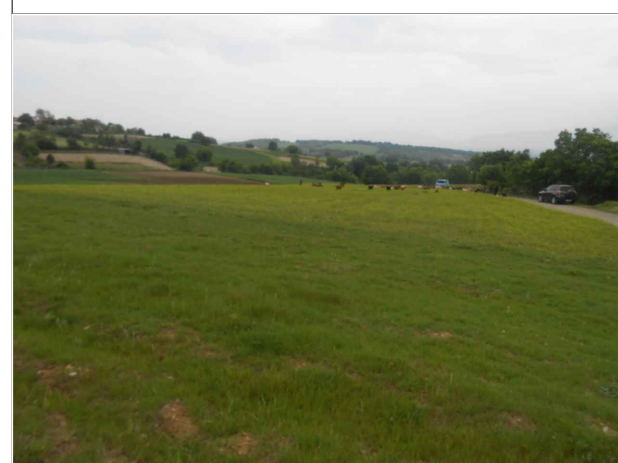
Λήψη από νότιοδυτική κορυφή του γηπέδου (φώτο 4)