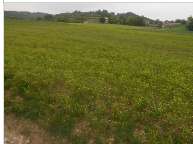
Λήψη από νότιοανατολική κορυφή του γηπέδου (φώτο 3)