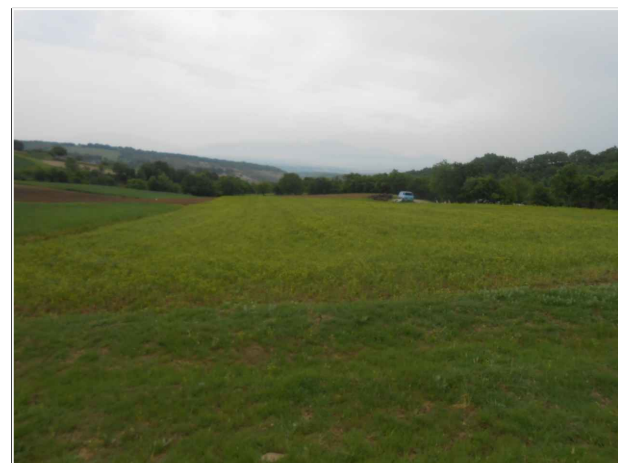
Λήψη από βορειοδυτική κορυφή του γηπέδου (φώτο 1)

ΤΟΠΟΓΡΑΦΙΚΟ ΔΙΑΓΡΑΜΜΑ ΓΗΠΕΔΟΥ ΔΗΜΟΣ ΓΡΕΒΕΝΩΝ ΤΟΠΙΚΗ ΚΟΙΝΟΤΗΤΑ ΜΑΥΡΑΝΑΙΩΝ, ΟΙΚΙΣΜΟΣ ΜΑΥΡΟΝΟΡΟΥΣ, ΘΕΣΗ: "ΑΥΓΟΤΟΠΟΣ" ΙΔΙΟΚΤΗΣΙΑ : ΣΑΪΤΣΗΣ ΙΩΑΝΝΗΣ, ΣΑΪΤΣΗΣ ΚΩΝΣΤΑΝΤΙΝΟΣ ΕΜΒΑΔΟΝ ΑΓΡΟΤΕΜΑΧΙΟΥ : 3.331,66 m 2 ΕΛΛΗΝΙΚΟ ΓΕΩΔΑΙΤΙΚΟ ΣΥΣΤΗΜΑ ΑΝΑΦΟΡΑΣ 1987 (Ε. Γ. Σ. Α. 87) ΠΡΟΒΟΛΗ ΕΓΚΑΡΣΙΑ ΜΕΡΚΑΤΟΡΙΚΗ ΚΛΙΜΑΚΑ 1: 500