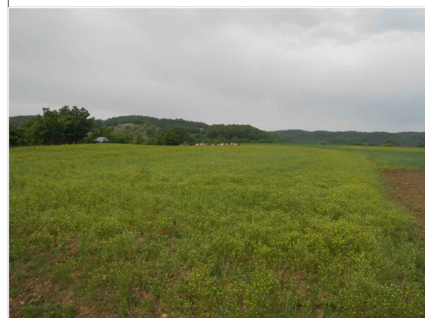
Λήψη από βορειοανατολική κορυφή του γηπέδου (φώτο 2)