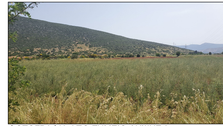
ΦΩΤΟΓΡΑΦΙΑ ΑΠΟ ΣΗΜΕΙΟ ΛΗΨΗΣ 3