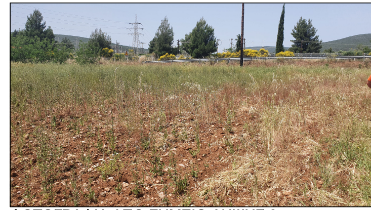
ΦΩΤΟΓΡΑΦΙΑ ΑΠΟ ΣΗΜΕΙΟ ΛΗΨΗΣ 2