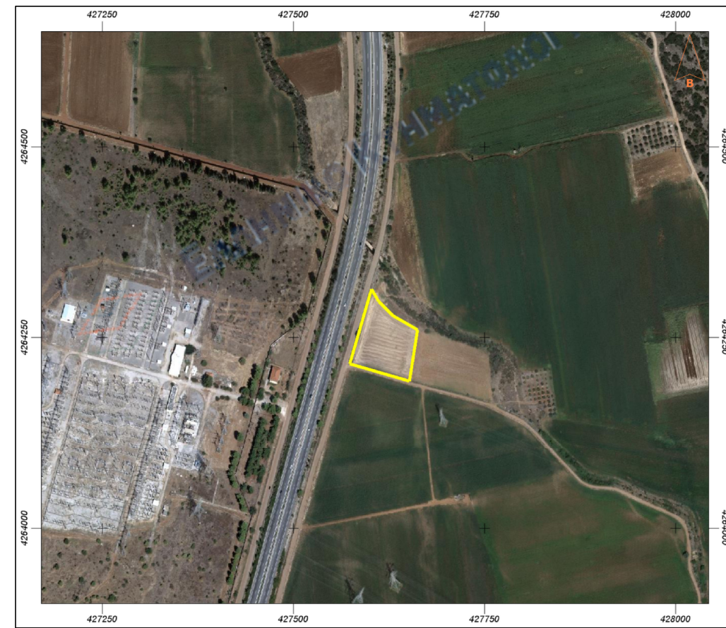
ΑΠΟΣΠΑΣΜΑ ΟΡΘΟΦΩΤΟΧΑΡΤΗ ΕΘΝΙΚΟΥ ΚΤΗΜΑΤΟΛΟΓΙΟΥ