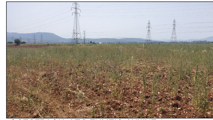
ΦΩΤΟΓΡΑΦΙΑ ΑΠΟ ΣΗΜΕΙΟ ΛΗΨΗΣ 1