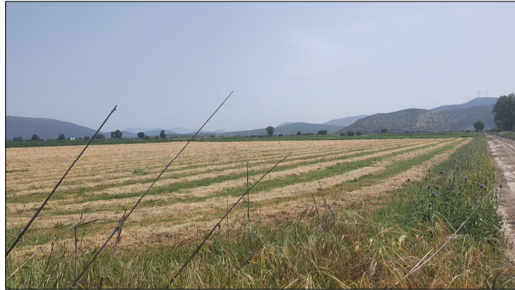
ΦΩΤΟΓΡΑΦΙΑ ΑΠΟ ΣΗΜΕΙΟ ΛΗΨΗΣ 3