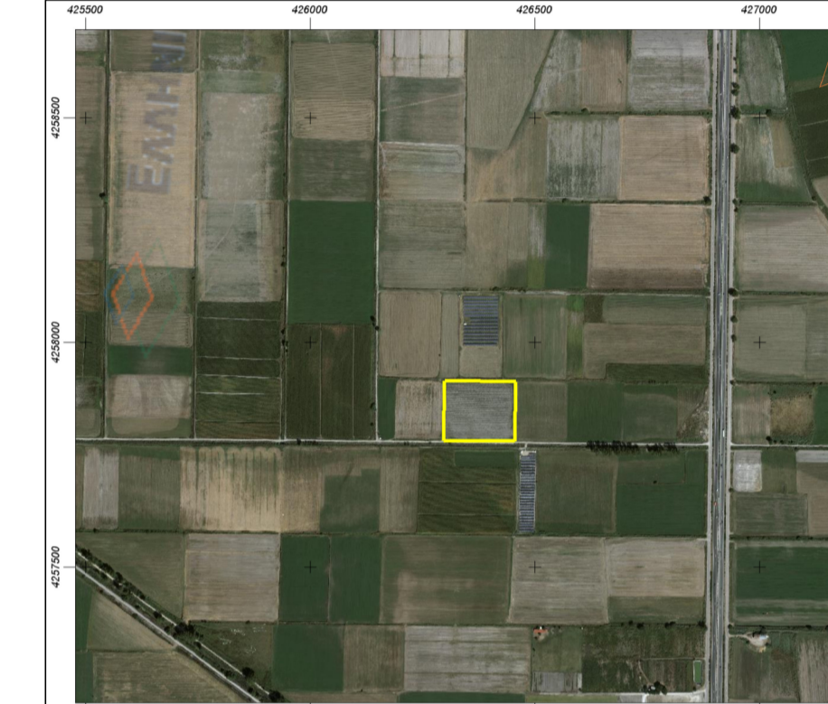
ΑΠΟΣΠΑΣΜΑ ΟΡΘΟΦΩΤΟΧΑΡΤΗ ΕΘΝΙΚΟΥ ΚΤΗΜΑΤΟΛΟΓΙΟΥ

ΔΗΛΩΣΗ ΜΗΧΑΝΙΚΟΥ (Ν.651/77 ΚΑΙ Ν.1337/83) ΔΗΛΩΩ ΣΥΜΦΩΝΑ ΜΕ ΤΟΝ ΝΟΜΟ ΓΙΑ ΤΟ ΓΕΩΤΕΜΑΧΙΟ ΑΒΓΔΕΖΑ ΜΕ ΕΜΒΑΔΟΝ 21.335,73 τ.μ. ΠΟΥ ΒΡΙΣΚΕΤΑΙ ΣΤΗΝ Τ.Κ. ΚΟΚΚΙΝΟΥ ΤΟΥ ΔΗΜΟΥ ΟΡΧΟΜΕΝΟΥ, ΤΗΣ Π.Ε. ΒΟΙΩΤΙΑΣ, ΤΗΣ ΠΕΡΙΦΕΡΕΙΑΣ ΣΤΕΡΕΑΣ ΕΛΛΑΔΑΣ ΟΤΙ: α) ΕΙΝΑΙ ΑΡΤΙΟ ΚΑΙ ΟΙΚΟΔΟΜΗΣΙΜΟ ΣΥΜΦΩΝΑ ΜΕ ΤΙΣ ΙΣΧΥΟΥΣΕΣ ΠΟΛΕΟΔΟΜΙΚΕΣ ΔΙΑΤΑΞΕΙΣ β) ΒΡΙΣΚΕΤΑΙ ΕΚΤΟΣ ΣΧΕΔΙΟΥ ΠΩΛΗΣ ΚΑΙ ΟΡΙΩΝ ΟΙΚΙΣΜΟΥ ΚΑΙ ΕΝΤΟΣ ΔΙΑΝΟΜΗΣ ΚΟΠΑΪΔΑΣ (ΑΡΙΘΜΟΣ ΤΕΜΑΧΙΟΥ 258) γ) ΕΝΤΟΣ ΤΟΥ ΓΕΩΤΕΜΑΧΙΟΥ ΔΕΝ ΔΙΕΡΧΟΝΤΑΙ ΕΝΔΕΡΙΕΣ ΓΡΑΜΜΕΣ ΜΕΤΑΦΟΡΑΣ ΥΨΗΛΗΣ ΤΑΣΗΣ ΤΗΣ ΔΕΗ ΚΑΙ ΔΕΝ ΔΙΕΡΧΟΝΤΑΙ ΑΓΩΓΟΣ ΦΥΣΙΚΟΥ ΑΕΡΙΟΥ, ΟΔΟΣ ΠΡΟΫΦΙΣΤΑΜΕΝΗ ΤΟΥ 1923 Η ΡΕΜΑ δ) ΕΝΤΟΣ ΤΩΝ ΟΜΟΡΩΝ ΙΔΙΟΚΤΗΣΙΩΝ ΔΕΝ ΥΦΙΣΤΑΝΤΑΙ ΔΙΑΤΗΡΗΤΕΑ ΚΤΗΡΙΑ ε) ΕΝΤΟΣ ΑΥΤΟΥ ΚΑΙ ΚΑΤΑ ΜΗΚΟΣ ΤΟΥ ΠΡΟΣΩΠΟΥ ΤΟΥ ΔΕΝ ΥΠΑΡΧΟΥΝ ΔΕΝΤΡΑ στ) Η ΙΔΙΟΚΤΗΣΙΑ ΔΕΝ ΥΠΑΓΕΤΑΙ ΣΤΙΣ ΔΙΑΤΑΞΕΙΣ ΤΟΥ Ν.1337/83 ΚΑΙ ΔΕΝ ΟΦΕΙΛΕΙ ΕΙΣΦΟΡΕΣ ΣΕ ΓΗ ΚΑΙ ΧΡΗΜΑ Ο ΜΗΧΑΝΙΚΟΣ