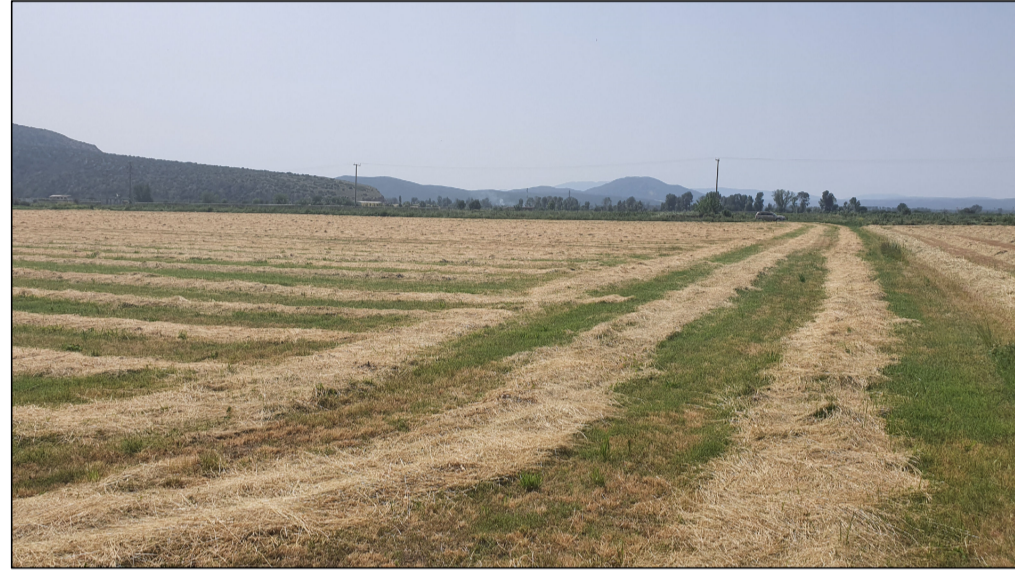
ΦΩΤΟΓΡΑΦΙΑ ΑΠΟ ΣΗΜΕΙΟ ΛΗΨΗΣ 2