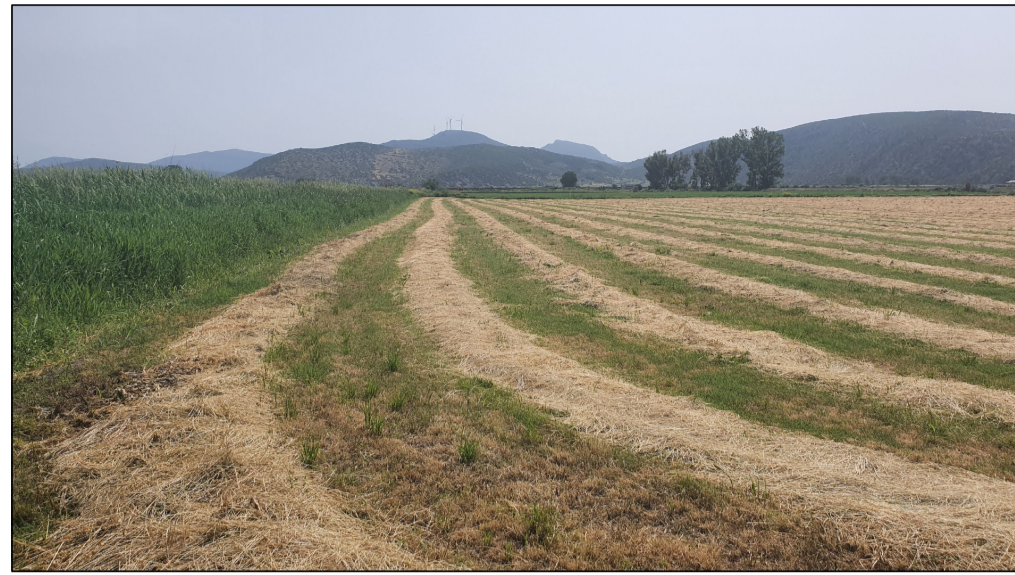
ΦΩΤΟΓΡΑΦΙΑ ΑΠΟ ΣΗΜΕΙΟ ΛΗΨΗΣ 1