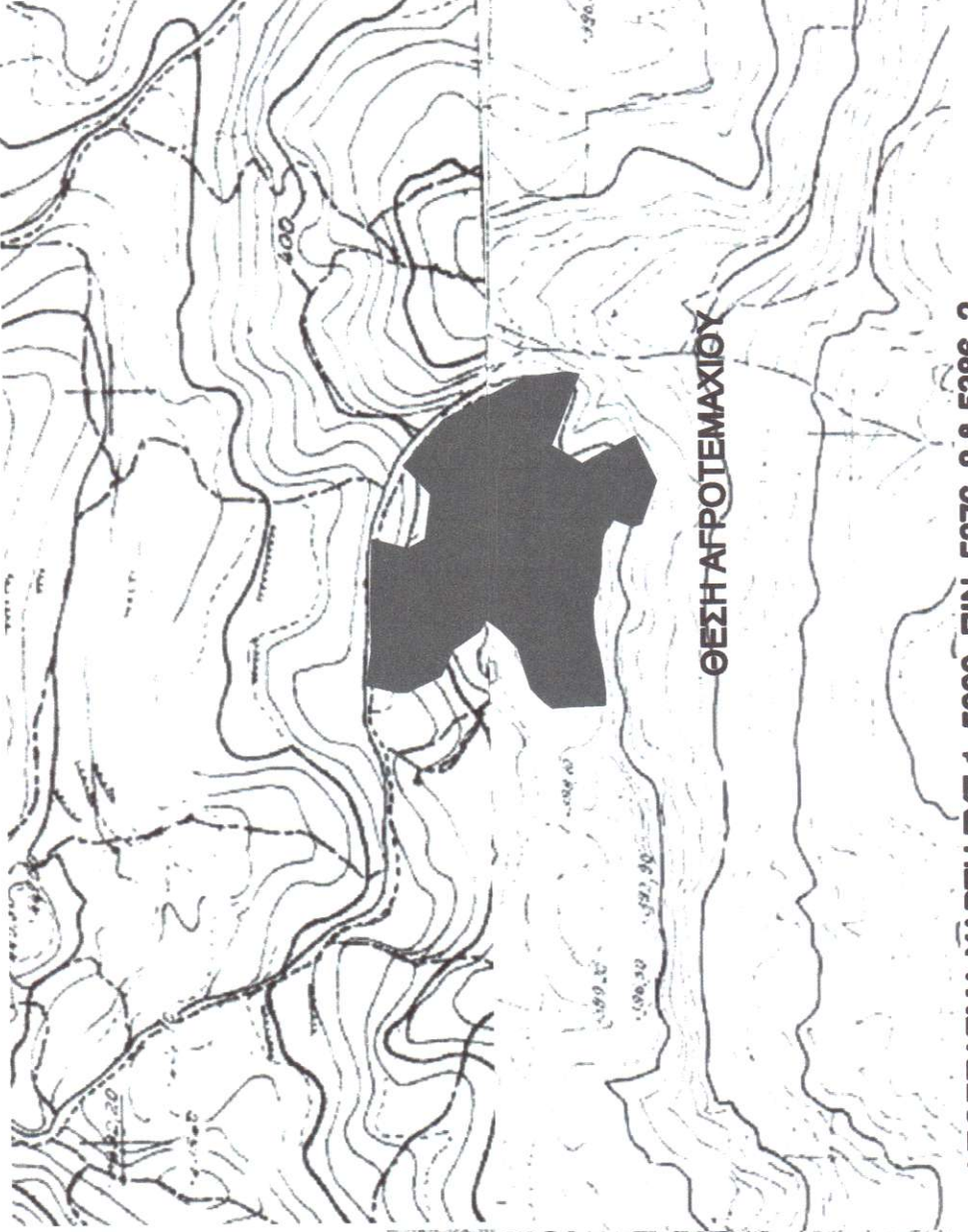
ΑΠΟΣΠΑΣΜΑ ΧΑΡΤΗ ΓΥΣ 1: 5000 ΠΙΝ 5376 8 & 5386_2

Πίνακας Συντεταγμένων των κορυφών του 1,2,3.....43 Εμβαδόν τετραγώνου = 25166,71 τ.μ. - Περιμετρός = 862,41 μ.