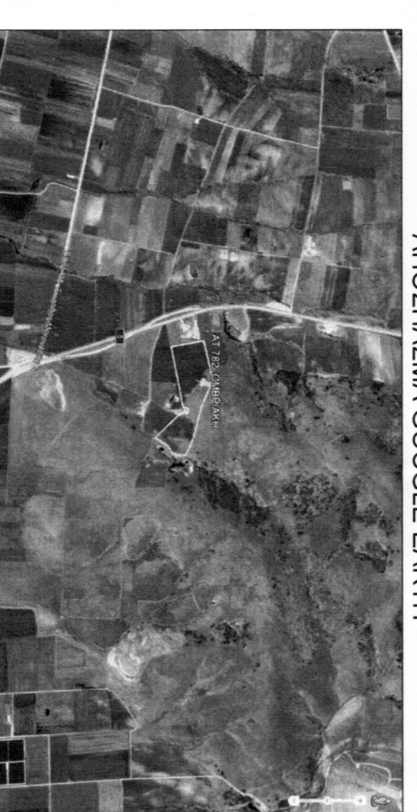
ΑΠΟΛΙΣΙΜΑ GOOGLE EARTH