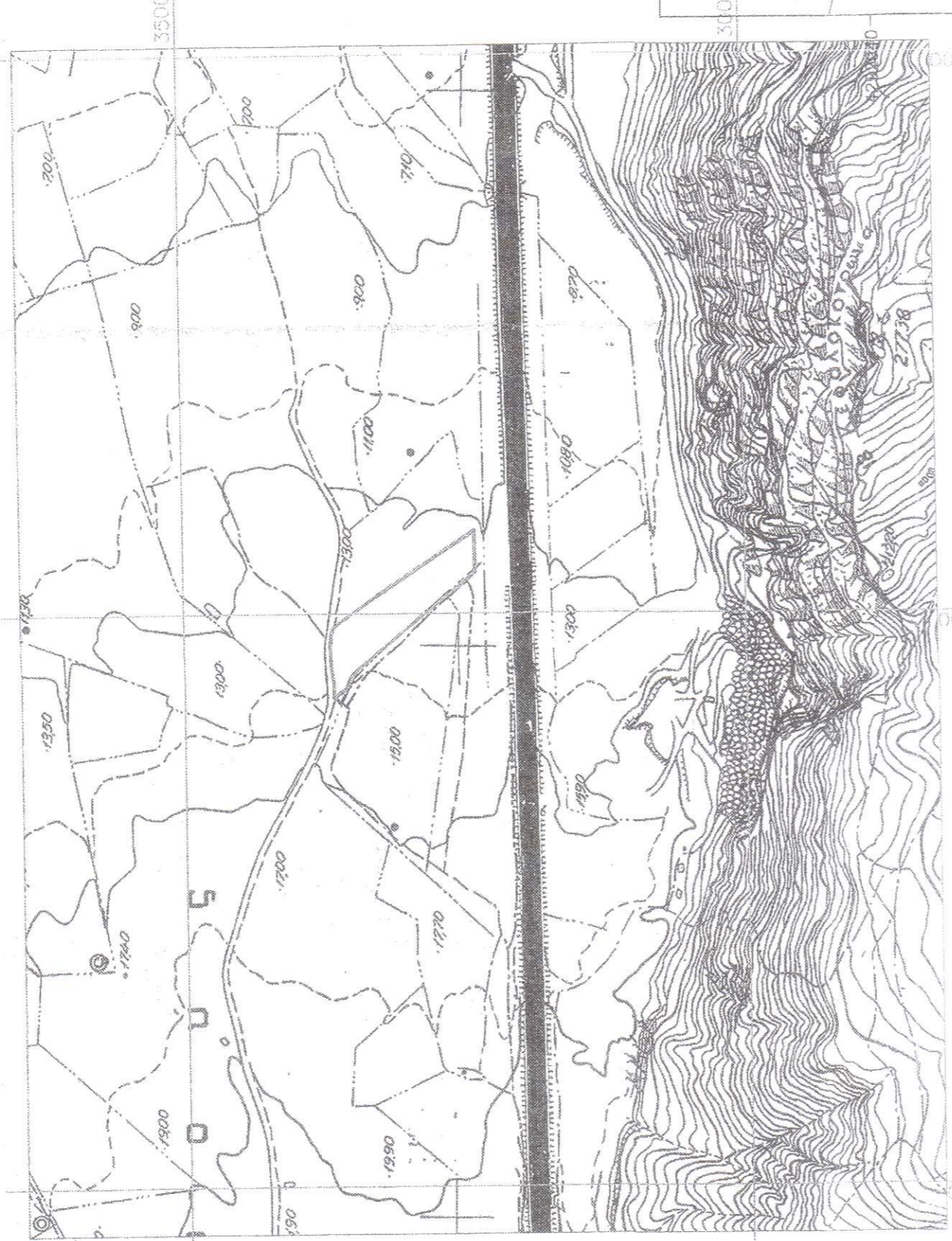
ΑΠΟΣΠΑΣΜΑ ΧΑΡΤΗ ΓΥΣ 5375/1 ΚΛΙΜΑΚΑ 1:5000