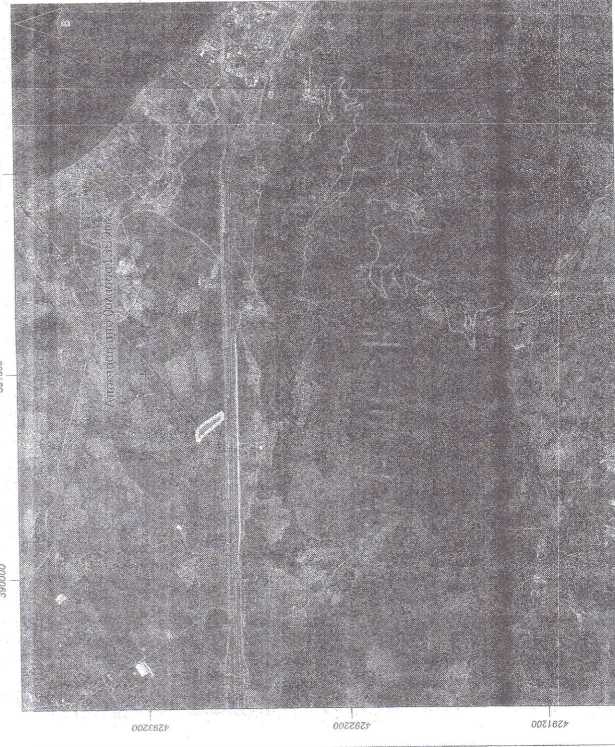
Απόσπασμα Εθνικού κτηματολογίου