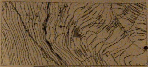
Αεροφωτογραφία Αεροφωτογράφισης 7.7.2. σε κλίμακα 1:25.000 (Αρ. Άδης 8127 Δ.Σ. 1/800 Πάρισιος - 1948) ΚΑΙΜΑΚΑ 1:1.000

ΕΜΒΑΔΟ ΓΗΠΕΔΟΥ Το γεωμετρικό ΕΓ που περιγράφεται με το στοιχεία 1), 2), 3), 4), 5), 6), 7), 8), 9), 10), 11), 12), 13), 14), 15), 16), 17), 18), 19) έχει εμβαδό Ε(ΕΓ) = 2.361,62 τ.μ. Το πραγματικό περιγραφόμενο γεωμετρικό διαμέρισμα εμβαδομετρήθηκε σύμφωνα με το Α. Κωδ.Α.Α.Α.