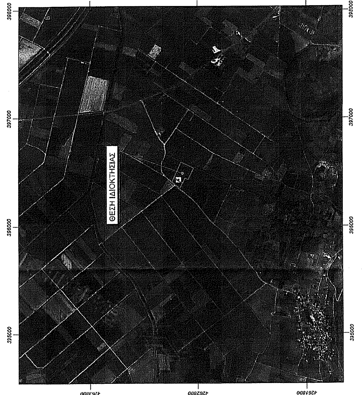
ΑΠΟΣΤΑΣΜΑ ΑΕΡΟΦΩΤΟΓΡΑΦΙΑΣ ΚΤΗΜΑΤΟΛΟΓΙΟΥ