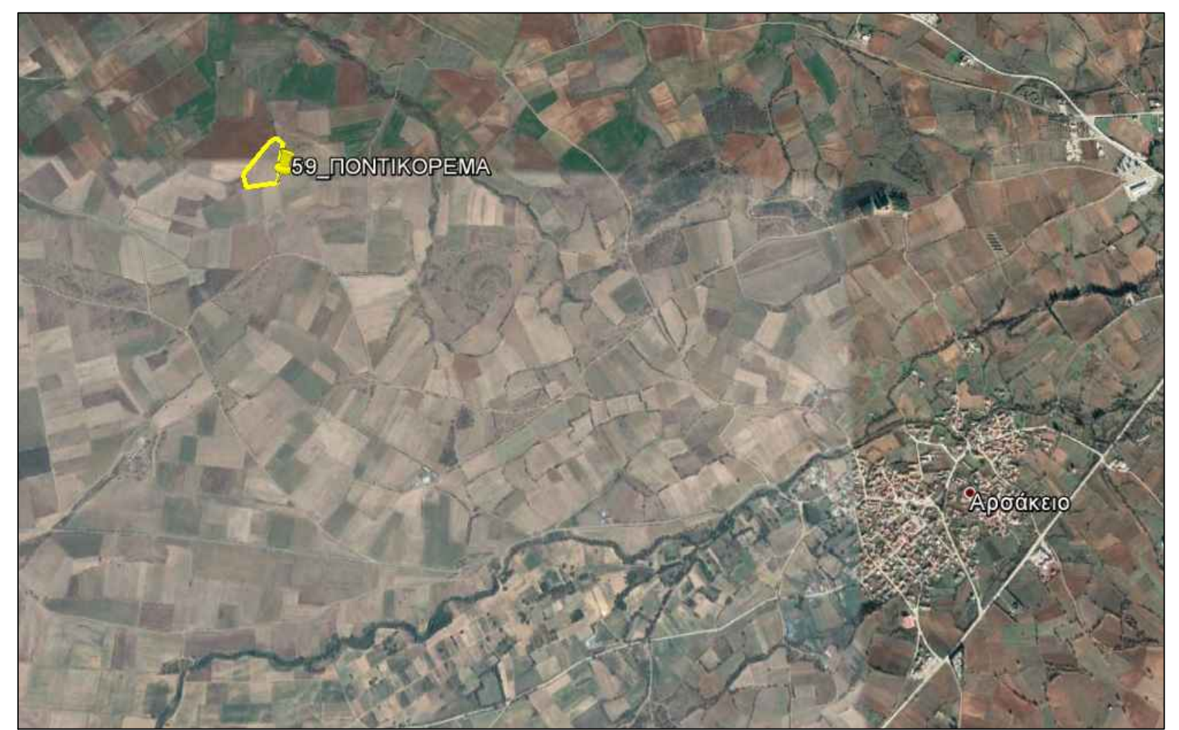
ΑΠΟΣΠΑΣΜΑ GOOGLE EARTH