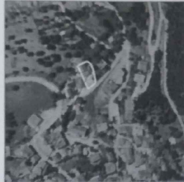
ΙΔ. ΕΛΛΗΚΟΜΙΚΟΥ ΑΜΠΕΛΟΥΡΓΙΚΟΥ ΑΓΡΟΤΙΚΟΥ ΣΥΝΕΤΑΙΡΙΣΜΟΥ ΠΑΤΡΩΝ