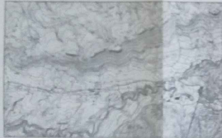
ΙΔ. ΕΛΛΗΚΟΜΙΚΟΥ ΑΜΠΕΛΟΥΡΓΙΚΟΥ ΑΓΡΟΤΙΚΟΥ ΣΥΝΕΤΑΙΡΙΣΜΟΥ ΠΑΤΡΩΝ