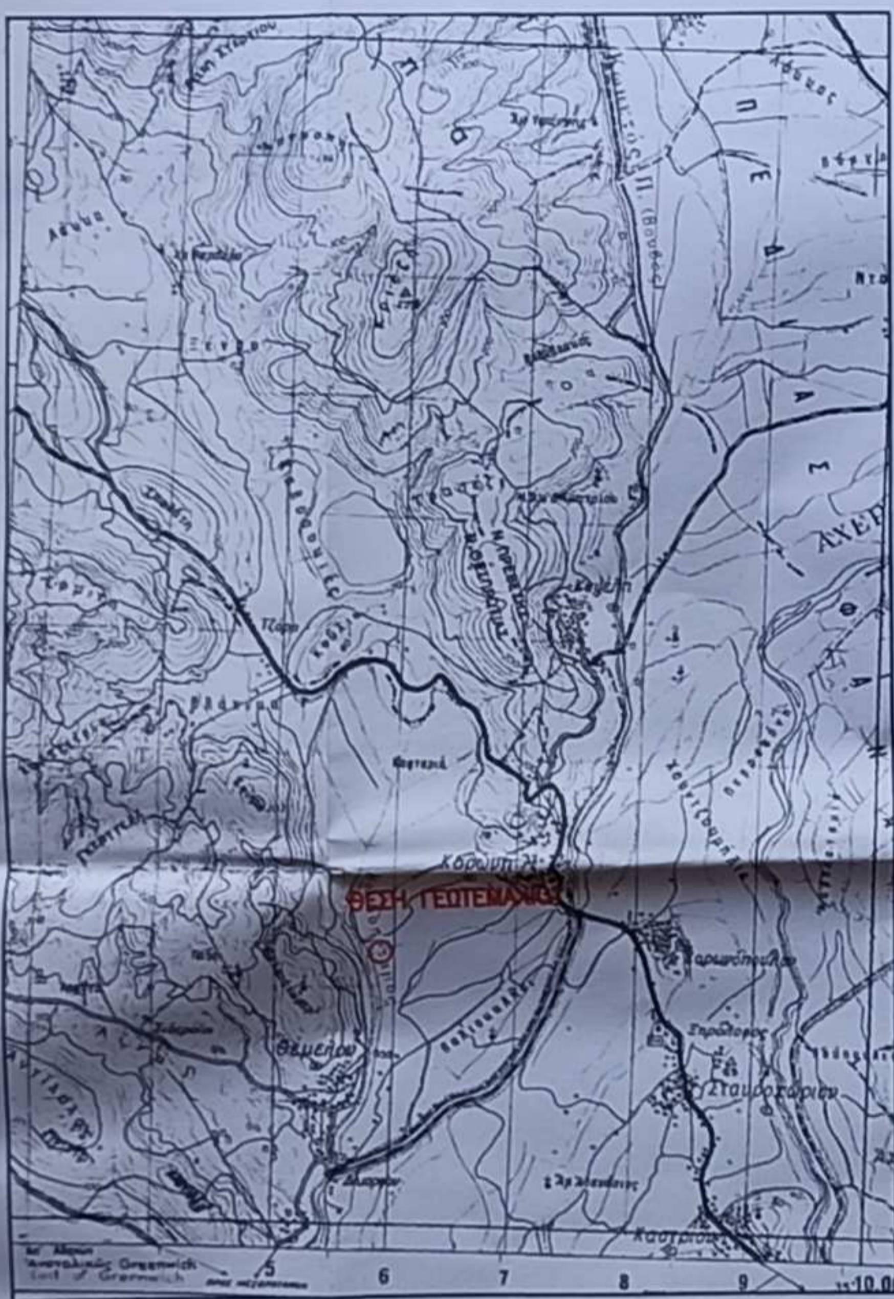
ΑΠΟΣΠΑΣΜΑ ΧΑΡΤΗ ΓΥΣ ΚΛΙΜΑΚΑΙ: 50000