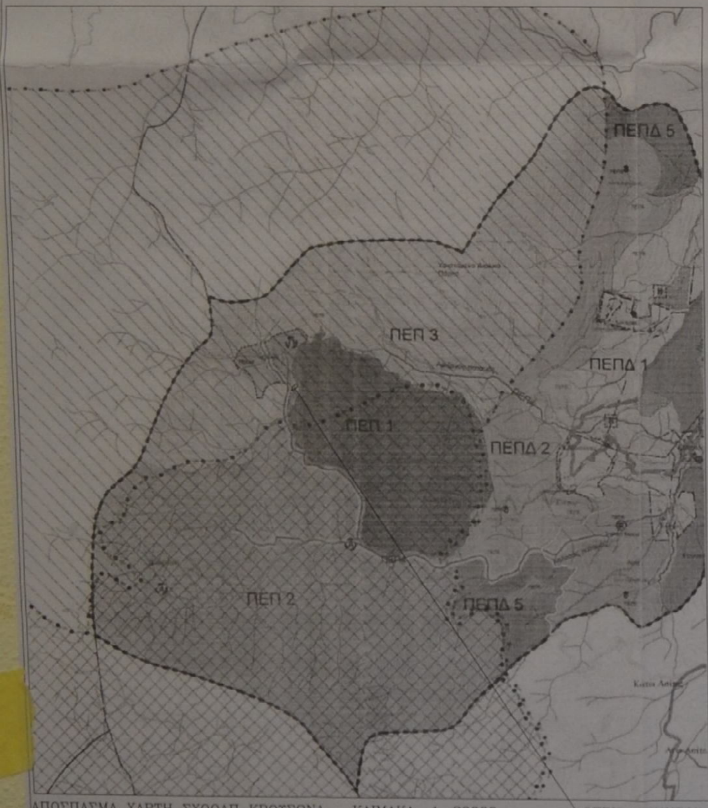
ΑΠΟΣΠΑΣΜΑ ΧΑΡΤΗ ΣΧΟΟΑΠ ΚΡΟΥΣΩΝΑ ΚΛΙΜΑΚΑ 1:20000 ΘΕΣΗ ΑΚΙΝΗΤΟΥ

ΓΙΑΝΝΗΣ Ι. Δ. ΑΘΑΝΑΣΙΟΥ Δ.Π.Π. ΜΗΧΑΝΙΚΟΣ ΜΕΛΟΣ Τ.Ε.Ε. ΑΡΧΙΤΕΚΤΟΝΩΝ ΚΑΙ Π.Ε.Π. ΜΗΧΑΝΙΚΩΝ ΕΒΑ ΑΝΤΙΣΤΑΣΕΩΣ Μ. ΣΧ. Τ.3 ΣΦ. ΗΡΑΚΛΕΙΟΥ ΤΗΛ. 2810 222992 - FAX 2810 222992 Α.Φ.Μ. 046438515 - Β.Δ.Ο.Υ. ΗΡΑΚΛΕΙΟΥ