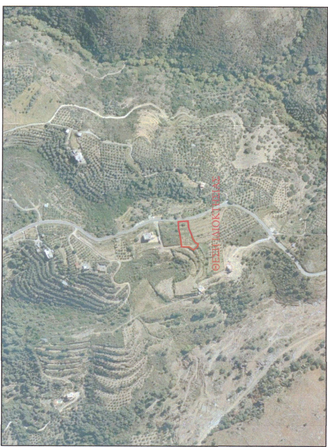
ΑΠΟΣΠΑΣΜΑ ΟΡΘΟΦΩΤΟΧΑΡΤΗΣ (ΟΔΟΠΟΡΙΚΟ) ΚΑΙΜΑΚΑ 1:5000