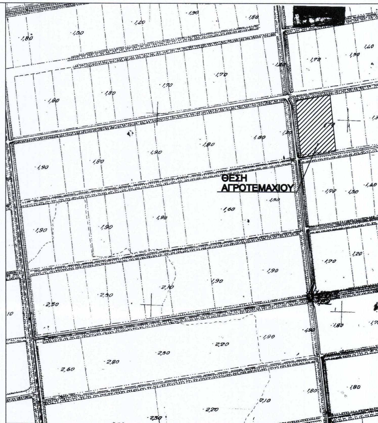
ΑΠΟΣΠΑΣΜΑ ΧΑΡΤΗ Γ.Υ.Σ. (5362/6) - ΚΛΙΜΑΚΑ 1: 5.000

ΘΕΩΡΕΙΤΑ και προσαρτάται στο 1628978/2020 Αριθμ. 29/09/2020 Αποθήκη ΕΛΛΗΝΙΚΗ ΔΗΜΟΚΡΑΤΙΑ ΔΗΜΟΣ ΛΑΜΙΩΝ ΔΙΕΥΘΥΝΣΗ ΒΑΣΙΛΕΙΟΥ ΔΑΣΟΛΟΓΟΣ με Α' βαθμό