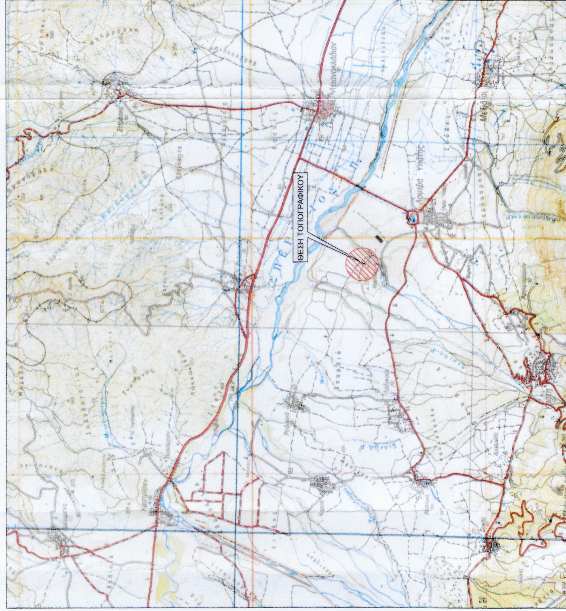
Θέση αγροτεμαχίου επί Χάρτου Γ.Υ.Σ. 1/50.000