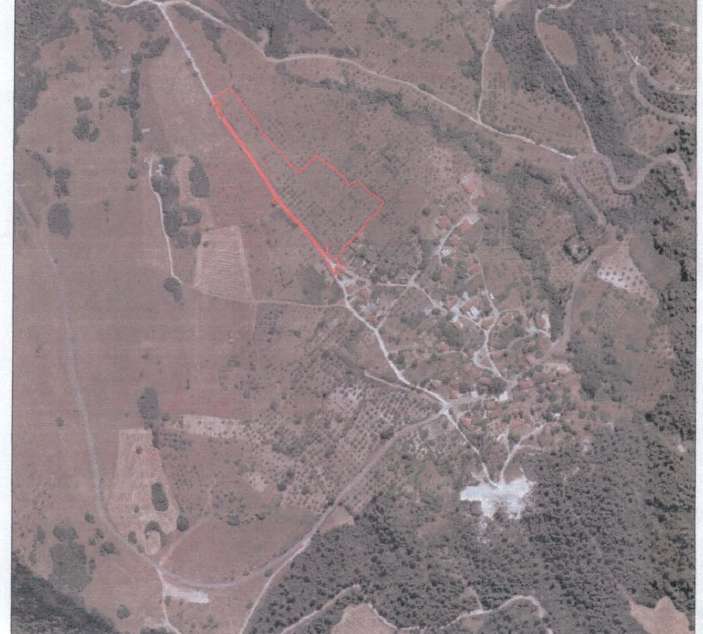
ΜΕΤΡΩΝ ΓΕΩΡΓΙΑΣ, ΔΕΥΑ

ΠΡΑΞΗ R έκταση στο ακρόατο (μετ. μετ.) 1510,90 m 2 (1510,90 m 2 ), εμβαδόν 1510,90 m 2 , κτήρ. όμοιο με το 1510,90 m 2 , κτήρ. όμοιο με το 1510,90 m 2 , κτήρ. όμοιο με το 1510,90 m 2 , κτήρ. όμοιο με το 1510,90 m 2 . ΚΑΡΑΒΔΙΑ ΝΩΛΟΥ ΑΓΡΟΤΕΜΑΧΙΟ Αποστολέα Καώ/να ΔΟΞΟΛΟΓΟΣ ΘΕΩΡΕΙΤΑ, ΑΝΤΙΚΑΤΑΣΤΑΣΗ ΑΡΧΗΣ ΓΥΕ 18305/18380 μετ. 13-10-2020 ΕΛΛΗΝΙΚΗ ΔΗΜΟΚΡΑΤΙΑ ΥΠΟΥΡΓΕΙΟ ΓΕΩΡΓΙΑΣ, ΑΓΡΟΤΙΚΗΣ ΑΝΑΠΤΥΞΗΣ ΚΑΙ ΚΤΗΝΙΑΤΡΙΑΣ ΕΓΚΛΗΤΗΡΙΟ ΜΕΤΡΩΝ ΑΝΤΙΚΑΤΑΣΤΑΣΗΣ ΑΡΧΗΣ ΓΥΕ