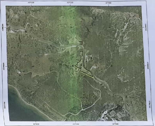
ΑΠΟΣΠΑΣΜΑ ΑΠΟ ΤΟΝ ΟΡΘΟΦΩΤΟΧΑΡΤΗ ΤΗΣ ΚΤΗΜΑΤΟΛΟΓΙΑΣ ΑΕ

ΠΑΡΑΤΗΡΗΣΕΙΣ-ΜΕΒΟΛΟΓΙΑ ΕΞΑΡΤΗΣΗΣ - ΤΟ ΔΙΑΓΡΑΜΜΑ ΕΙΝΑΙ ΕΠΙΤΑΓΜΕΝΟ ΕΣΤΙ ΚΡΑΤΙΚΟ ΣΥΣΤΗΜΑ ΣΥΝΤΕΤΑΓΜΕΝΩΝ ΕΓΕΙΑ 87'. - Η ΕΞΑΡΤΗΣΗ ΑΠΟ ΤΟ ΕΓΕΙΑ 87' ΕΓΙΝΕ ΜΕ ΔΕΚΤΗ GSN 5880Τ THE SOUTH (Serial No 588273123108707) ΜΕ ΑΚΡΙΒΕΙΑ ΜΕΤΡΗΣΗΣ ΟΡΙΖΟΝΤΙΑΓΡΑΦΙΚΑ 1cm=1ppm ΜΗΚΟΥΣ ΒΑΘΕΣ ΚΑΙ ΥΨΟΜΕΤΡΙΑ 1.5cm=1ppm ΜΗΚΟΥΣ ΒΑΘΕΣ. - Η ΑΡΧΙΤΕΚΤΟΝΙΚΗ ΕΓΙΝΕ ΜΕ ΤΗΝ ΜΕΘΟΔΟ ΤΗΣ ΚΤΗΜΑΤΟΛΟΓΙΑΣ ΜΕΤΡΗΣΗΣ ΠΡΑΓΜΑΤΙΚΟΥ ΧΡΟΝΟΥ (ΡΤΚ) ΚΑΘΩΣΤΟΣ ΚΡΗΝ ΤΟΥ ΙΔΙΩΤΙΚΟΥ ΔΙΚΤΥΟΥ ΤΗΣ ΜΕΤΡΙΣΑ ΜΕ ΣΥΝΤΕΤΑΓΜΕΝΕΣ ΒΑΘΕΣ (ΚΟΡΥΦΩΣ) (X=405913.5876, Y=4199583.4293, H=18.0477) - ΟΙ ΠΑΡΑΤΗΡΗΣΕΙΣ ΔΙΕΞΗΚΩΝΕΝ ΤΗΝ 08-10-20 ΚΑΙ ΩΡΑ ΑΠΟ 12.30μ. - ΟΙ ΔΙΑΤΑΞΕΙΣ ΚΑΙ ΤΑ ΕΜΒΑΣΑ ΥΠΟΛΟΓΙΣΤΗΚΑΝ ΑΝΑΛΥΤΙΚΑ ΑΠΟ Π.Ε. ΣΥΝΤΕΤΑΓΜΕΝΕΣ ΤΩΝ ΚΟΡΥΦΩΝ