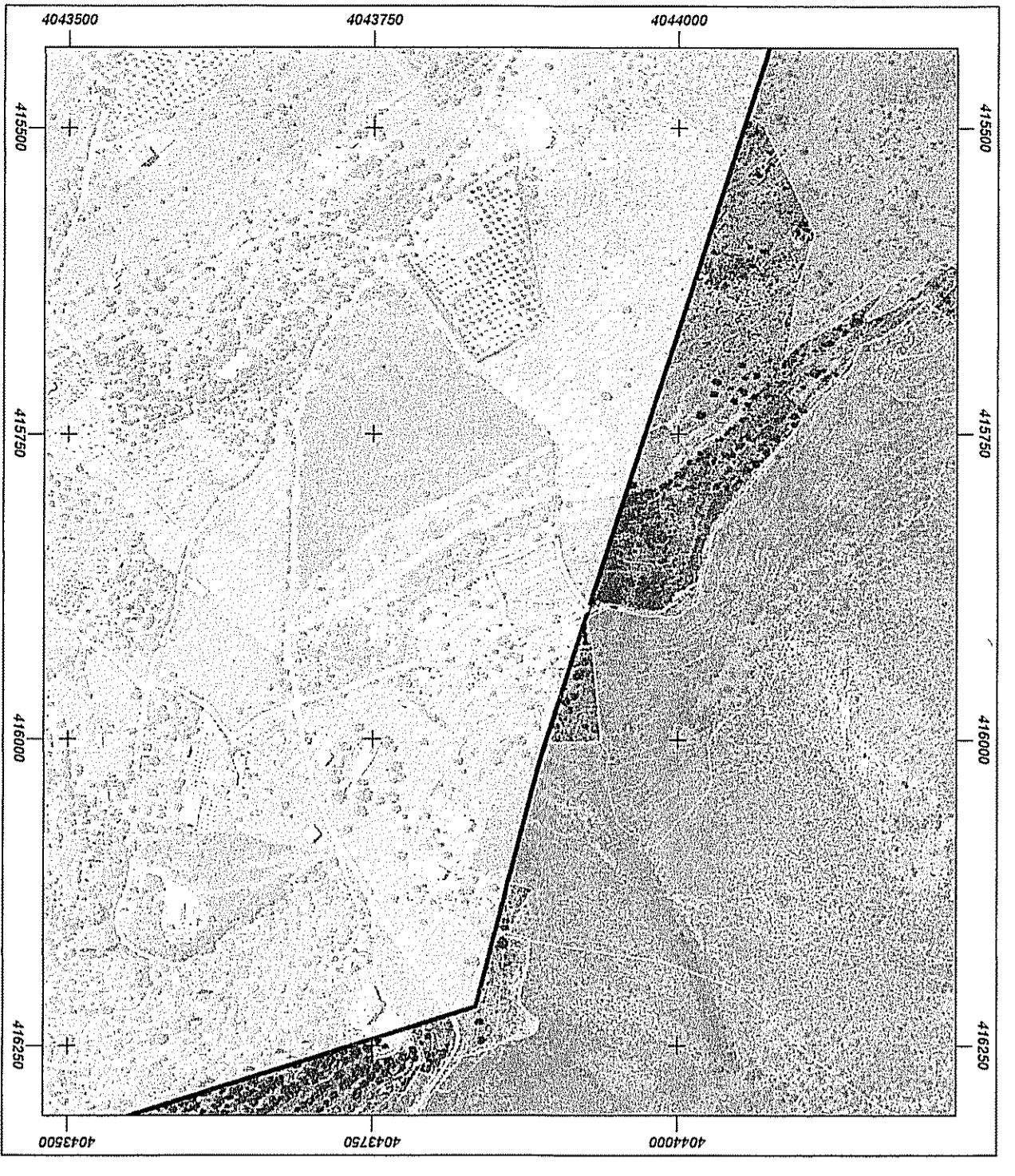
ΑΠΟΣΤΑΣΜΑ ΑΕΡΟΦΩΤΟΓΡΑΦΙΑΣ ΕΣΙΚΟΥ ΚΤΗΜΑΤΟΛΟΓΙΟΥ