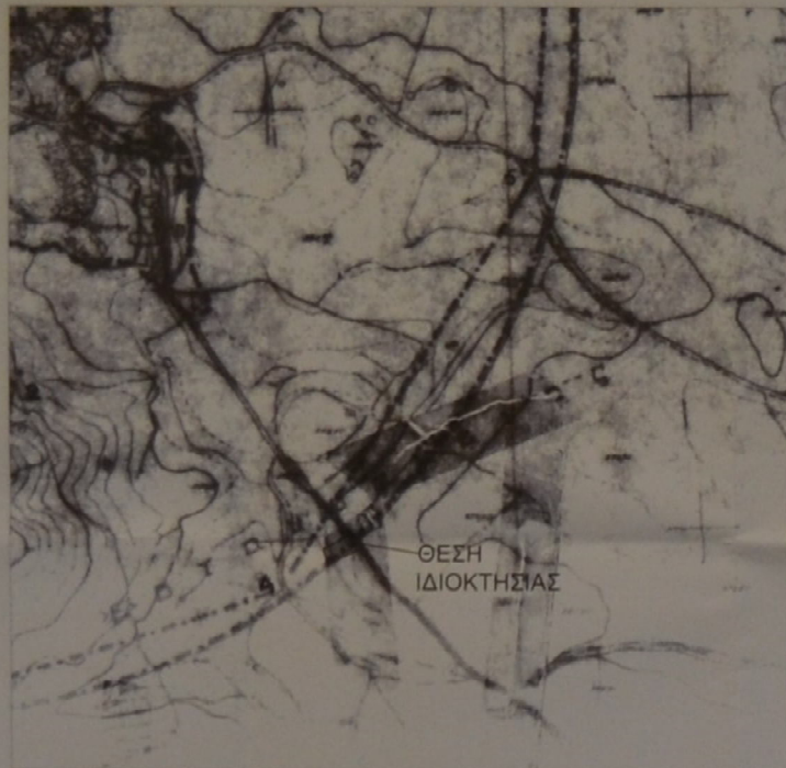
Απόσπασμα Χάρτη Ορίων Οικισμού Μοχού - κλ. 1:5000