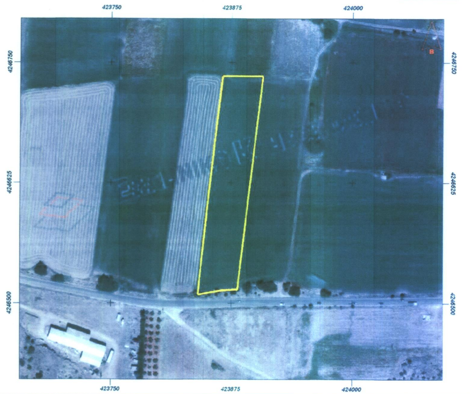
Απόσπασμα ορθοφωτογραφίας Ελληνικό Κτηματολόγιο