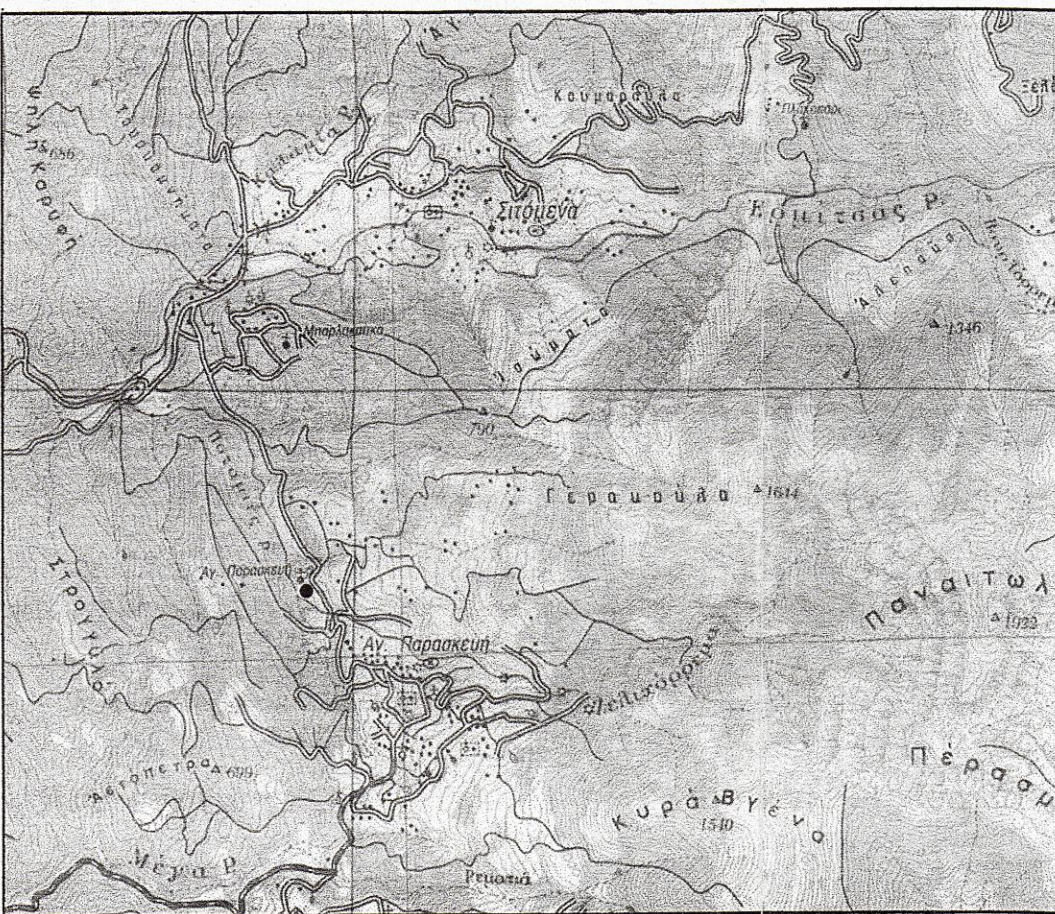
ΘΕΣΗ ΕΓΚΑΤΑΣΤΑΣΗΣ ΣΕ ΑΠΟΣΠΑΣΜΑ ΧΑΡΤΗ 1:50.000