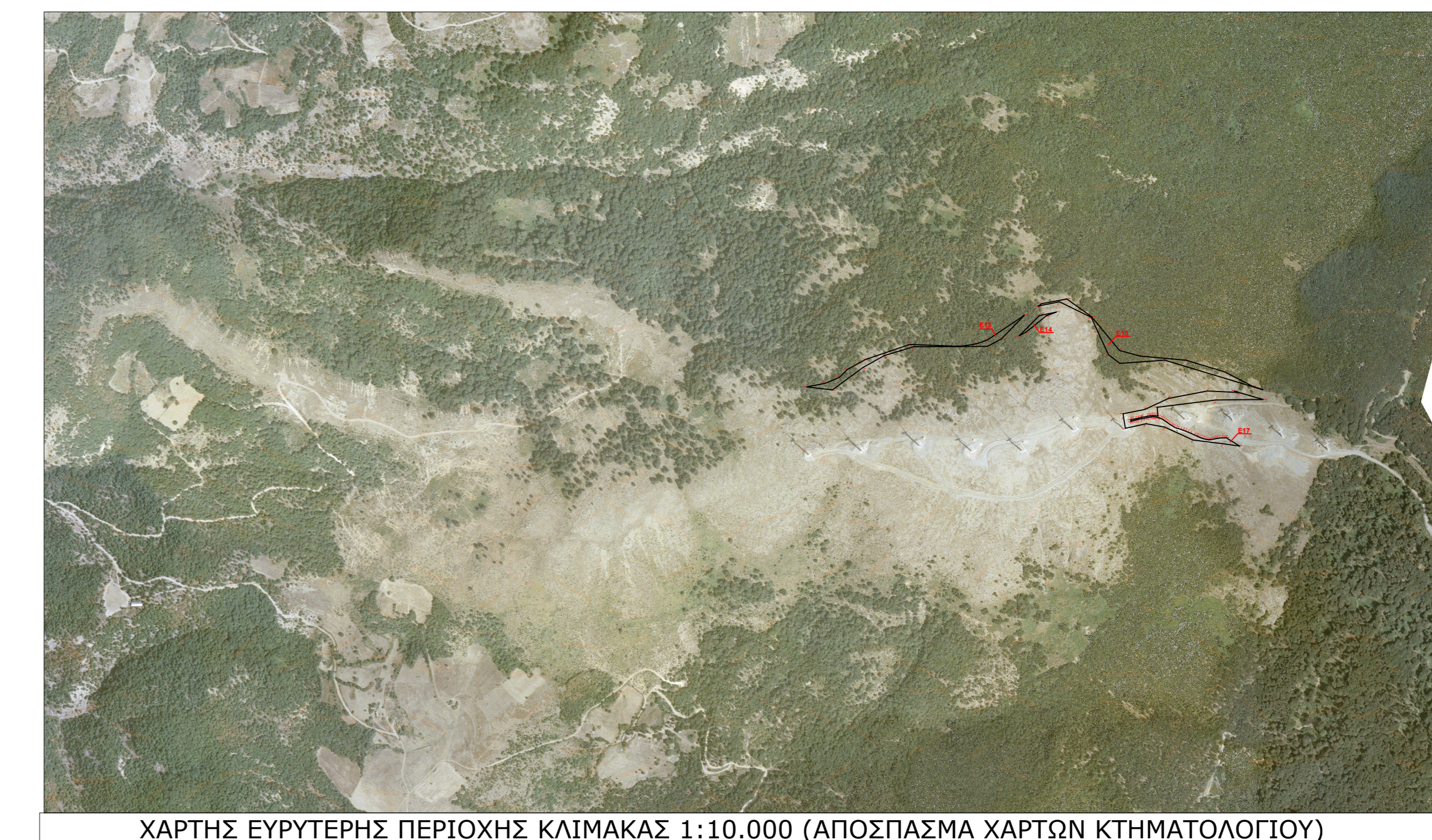
ΧΑΡΤΗΣ ΕΥΡΥΤΕΡΗΣ ΠΕΡΙΟΧΗΣ ΚΛΙΜΑΚΑΣ 1:10.000 (ΑΠΟΣΠΑΣΜΑ ΧΑΡΤΩΝ ΚΤΗΜΑΤΟΛΟΓΙΟΥ)

ΒΕΒΑΙΩΣΗ Ο κάτωθι υπογράφων μηχανικός δηλώνει ότι οι εκτάσεις που περιγράφονται στο παρόν τοπογραφικό διάγραμμα με στοιχεία Ε13,Ε14,Ε15,Ε17, συνολικού εμβαδού 24.452,67' δεν εμπιπουν εντός εποικιστικού συγκροτήματος, δεν κατέχουν κοινόχρηστη έκταση και κατ'επέκταση δεν υπόκεινται στη διαχείριση του Τμήματος Τοπογραφίας Επικασιμού & Αναδομίου της Δ/σης Αγροτικής Οικονομίας & Κτηνιατρικής Π.Ε. Ροδόπης Ο ΜΗΧΑΝΙΚΟΣ