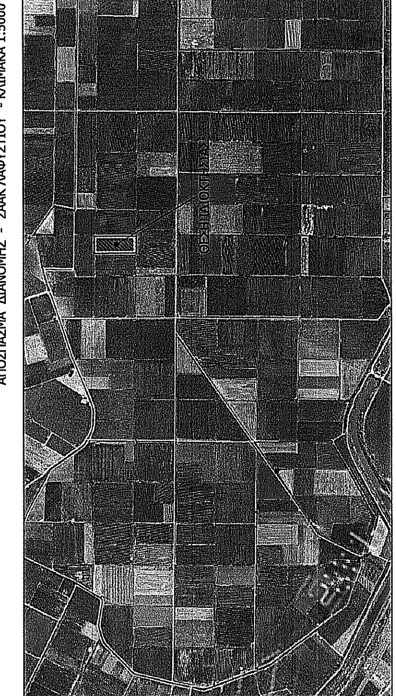
ΑΠΟΣΤΑΣΙΑ ΔΙΑΔΟΧΗΣ - "ΣΑΚ ΛΑΦΥΣΤΙΟΥ" - ΚΥΜΑΚΑ 1:5000