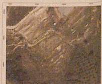
ΑΠΟΣΠΑΣΜΑ ΟΡΟΦΟΤΟΚΑΡΤΗΣ ΕΚΧΑ ΚΑ 1.2000

ΟΡΟΣ ΔΙΑΒΗΘΗΣ ΔΗΜΟΣ: Κεφαλονιά, ΠΕΡΙΟΧΗ: Λουκέρτα (εκτός οικισμού) ΕΚΤΟΣ ΟΙΚΙΣΜΟΥ Αριθ. Πρωτ. 7/16-8-23, Αριθ. Απόφ. από τηρ. 6/16-8-23/17-12-25, Αριθ. Π. 307/2023, Αριθ. Π. 2491/5-8-25 α) Όριο και η προσαρμογή διαμέτρων των ακαθίστων β) Τα εμβαδά των ακαθίστων Εμβαδά εμβαδών: 4000 τ.μ. (Π. 65) Κατά παρακολούθηση της πολεοδομικής παράγραφου θεωρούνται όρια και ακαθίστατα Τα όρια αυτά από 31-5-85, Αριθ. Διατάξεως της Π. 1224-8-85, (ΦΕΚ 2732/85) όρατα προκύπτει σε επιφανείες, όριση και καταστάσεις όπως έχουν γίνει γ) Τα όρια αυτά υπάρχουν από 17-10-78, Αριθ. Διατάξεως της Π. 616-10-78 (ΦΕΚ 530/78) Εμβαδά γκαζόνια (δύο είναι 200) τ.μ. Εμβαδά εμβαδών: Δύο γκαζόνια (2000) τ.μ. δ) Τα όρια αυτά που Διατάχθηκαν από την 17-10-78 μέχρι την 21-5-85 Εμβαδά εμβαδών: Αρκετά γκαζόνια (4000) τ.μ. 2. Μέγεθος ποσοστίου κάλυψης: 200μ 2 0,22% (8-4000) 3. Διάμετρος: 200μ (87,87-4000) 4. Μέγεθος όριου αποστάσεων: 7,50μ+1,20μ στην (2 όρια) 5. Σε 10,0μ 6. Μέγεθος ανακάλυψης όριου: 5,5