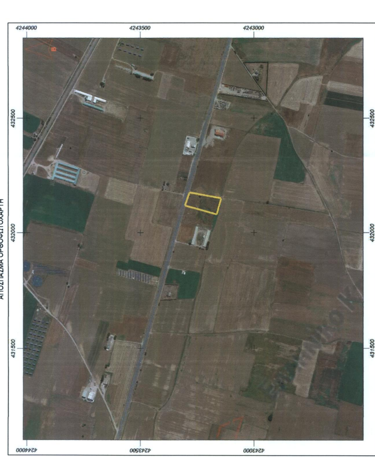
ΦΧ ΓΥΣ 6410/5

ΥΠΕΥΘΥΝΗ ΔΗΛΩΣΗ ΔΙΟΙΚΗΤΗ Ο υπεύθυνος διοκτήτης του γεωμάχου με στοιχεία (Α-Β-Γ-Δ-Α) το οποίο βρίσκεται εκτός σχεδίου πόλης, τ.κ. Βαγίων, Δήμου Θηβών, όπως περιγράφεται αναλυτικά στο παρόν τοπογραφικό διάγραμμα, δηλώνω υπεύθυνα ότι τα αναγραφόμενα όρια είναι απολύτως αληθή, ενώ τέθηκαν παρουσία μου και καθ' ύλην αρμοσίαν μου. Ο Διοκτήτης