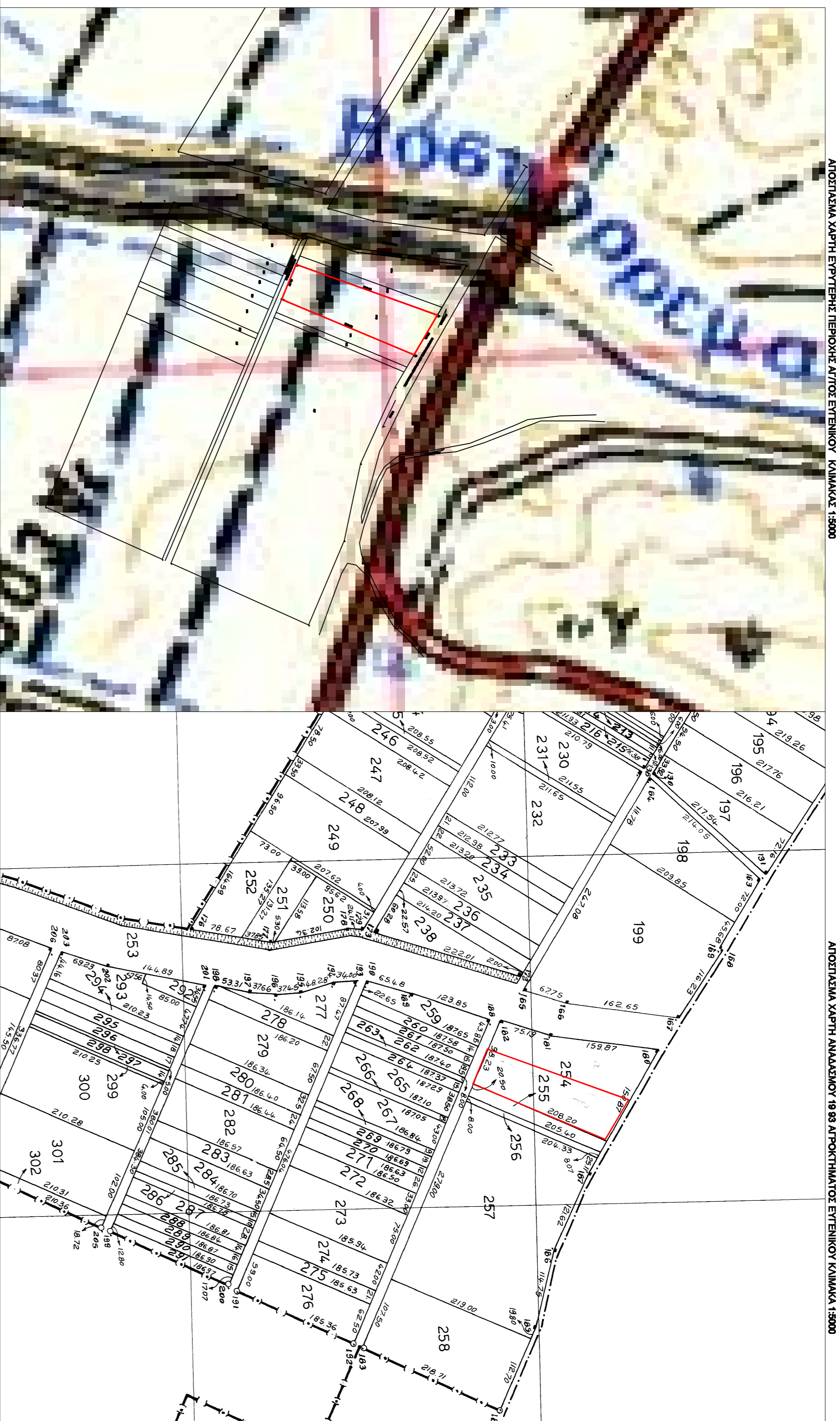
ΑΝΟΣΙΣΤΑΜΑ ΧΑΡΤΗ ΕΡΓΕΤΗΡΙΩΝ ΠΕΡΙΟΧΗ ΑΓΙΟΣ ΕΥΤΕΡΙΚΟΣ ΚΑΙΜΑΚΑ 1:800