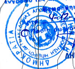
ΣΥΝΤΕΤΑΓΜΕΝΕΣ ΣΕ ΗΑΤΤ

ΔΗΜΟΚΡΑΤΙΑ ΑΠΟΚΕΝΤΡΩΜΕΝΗ ΔΙΟΙΚΗΣΗ ΗΠΕΙΡΟΥ - ΔΥΤ. ΜΑΚ/ΝΙΑ Δ/ΝΣΗ ΔΑΣΩΝ ΑΡΤΑΣ Η παρούσα ανήκει στο υπ' αριθμ. 197081/4-12-2020 έγγραφο της Δ/νσης Δασών Αρτας 4-12-2020 Δ/νσης ΔΗΜΗΤΡΙΟΣ ΧΕΛΑΣ ΔΑΣΟΛΟΓΟΣ