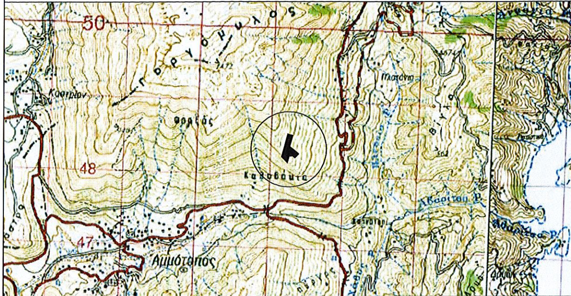
ΣΥΝΤΕΤΑΓΜΕΝΕΣ ΣΕ ΗΑΤΤ

ΧΑΡΤΗΣ ΠΡΟΣΑΝΑΤΟΛΙΣΜΟΥ ΚΛΙΜΑΚΑΣ 1:50.000