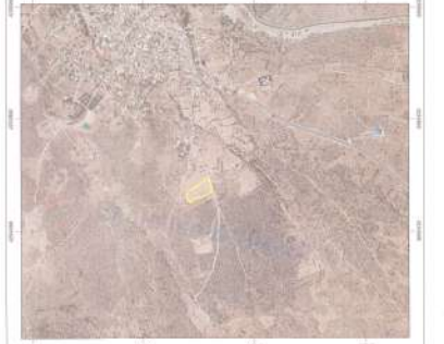
ΑΠΟΣΠΑΣΜΑ ΑΠΟ ΚΤΗΜΑΤΟΛΟΓΙΟ