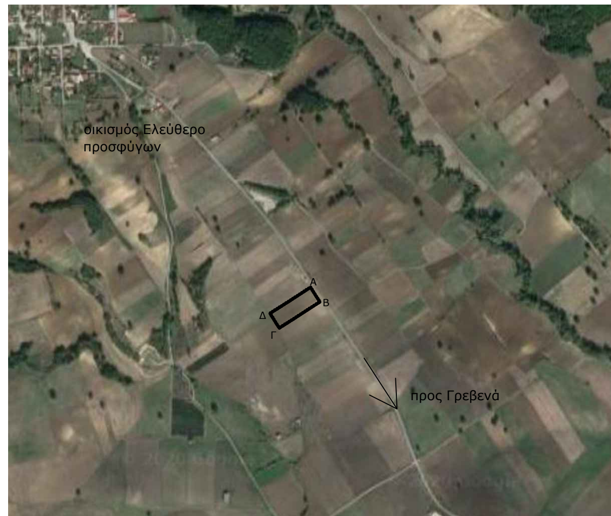
Οδοπορικό ακαρίφημα - θέση κληροτεμαχίου επί αποσπάματος δορυφορικής εικόνας