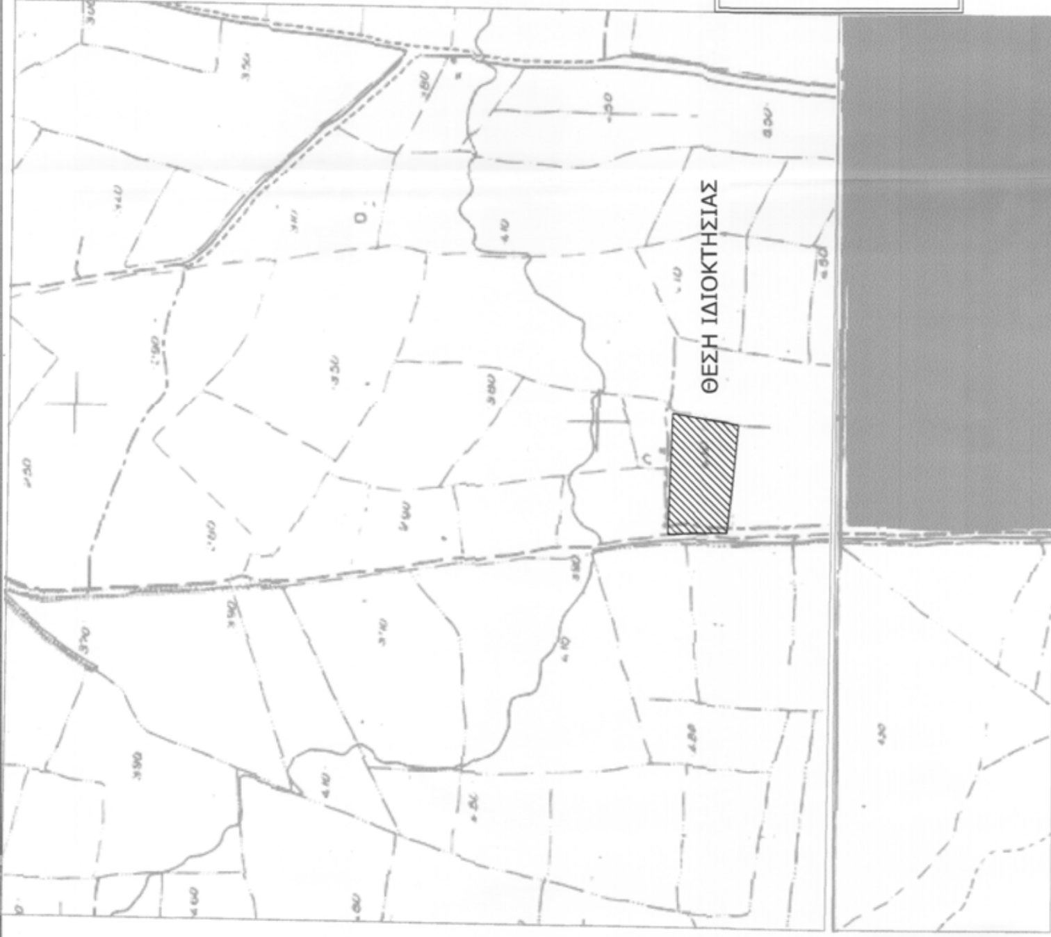
ΑΠΟΣΠΑΣΜΑΤΑ ΧΑΡΤΩΝ ΓΥΣ αριθμ. 5364,6 και 5364,8 κλ. 1/5000