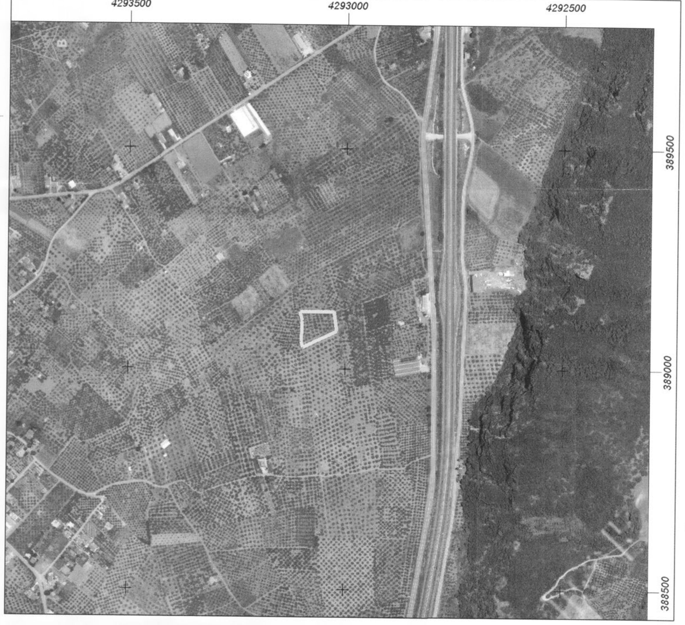
Απόσπασμα Εθνικού κτηματολογίου

ΟΡΓΟΣ ΣΧΕΔΙΟΥ-ΝΑΤΟΥΡΑ 2000 Κ. 3957/2018 (Φ.Ε.Κ. 60/ΑΦΔ-31/1) Α. 3957/2018 (Φ.Ε.Κ. 60/ΑΦΔ-31/1) ΕΚΤΟΣ ΣΧΕΔΙΟΥ-Π. ΔΙΤΜΑ 2433-5-1965 Εμβαδόν κανόνος : 4.000 μ 2 . Πρόσκατα: 25,0 μ. Κ.Ε. -10% Σ.Δ. -20% Υψος: 7,50 μ. Για κατοικία max: 200,00 μ 2 + 4000Χ2% + (Ε-8000 Χ1% Παράκαλοι: Προκηρτίσματα ης 17-16-1978 ελάχιστο εμβαδόν 4000μ 2 (Π.Δ. 6-10-78 Φ.Ε.Κ. 638/0)