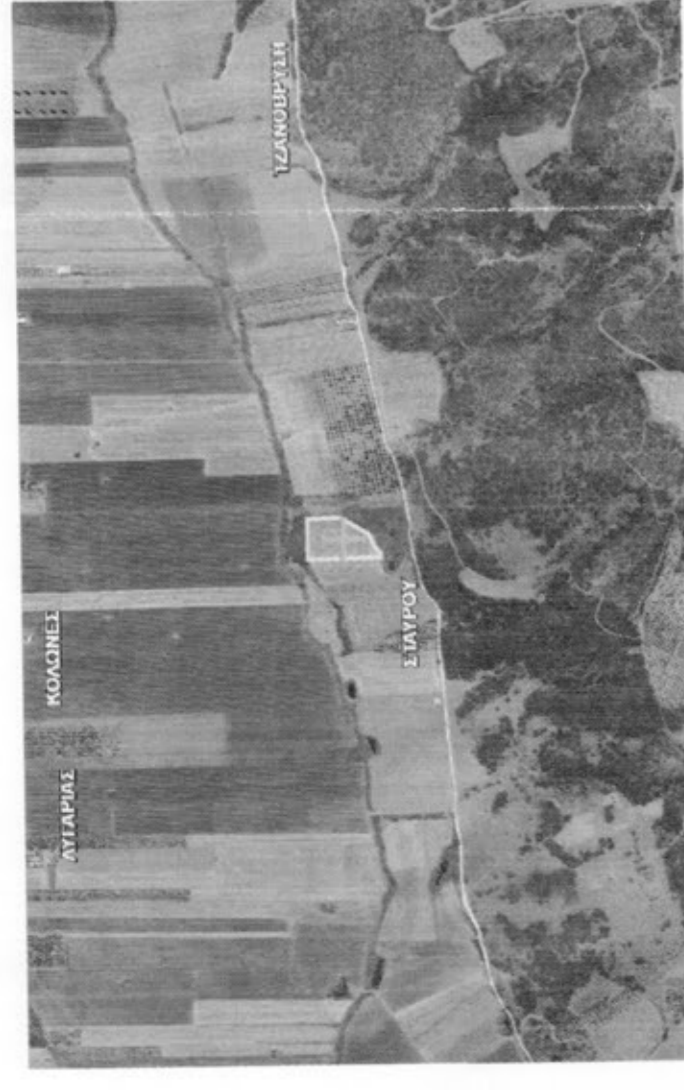
ΑΠΟΣΠΑΣΜΑ ΣΧΕΔΙΟΥ ΠΕΡΙΟΧΗΣ