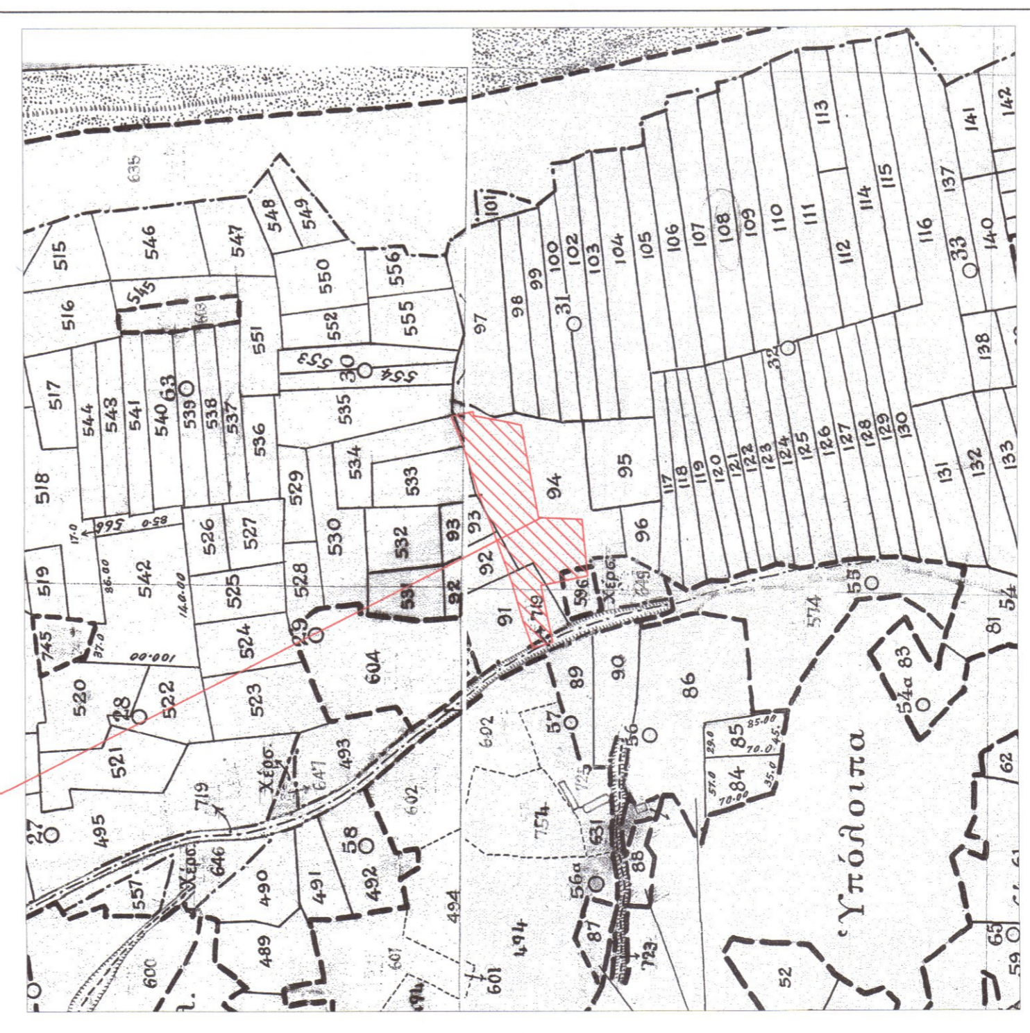
ΑΠΟΣΠΑΣΜΑ ΑΠΟ ΟΡΘΟΦΩΤΟΧΑΡΤΗ ΚΛΙΜΑΚΑ 1:5000 ΘΕΣΗ ΑΓΡΟΤΕΜΑΧΙΟΥ