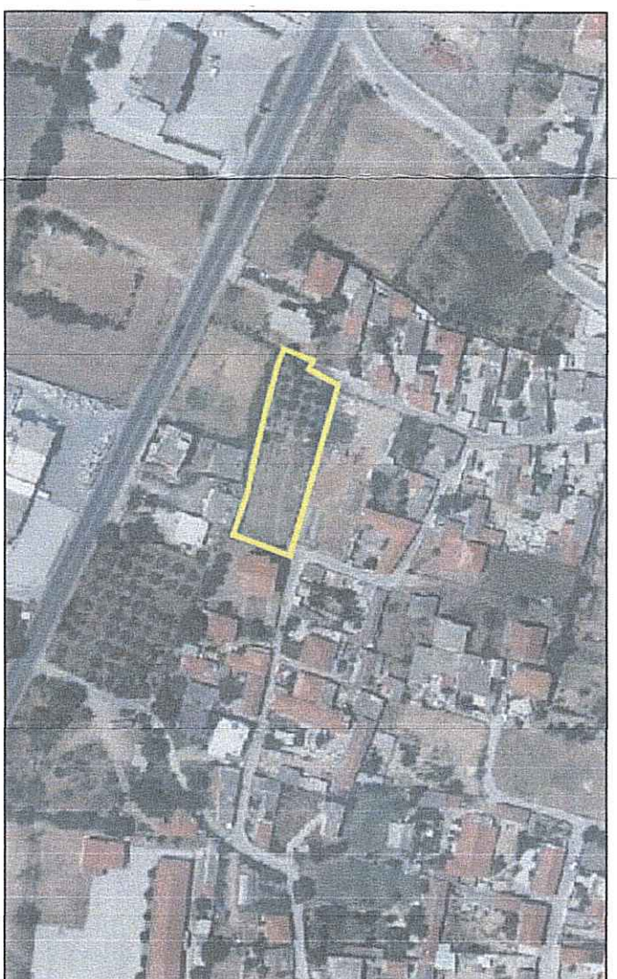
ΑΠΟΤΥΠΩΜΑ ΟΡΘΟΦΩΤΟΓΡΑΦΗ ΕΛΛΗΝΙΚΟΥ ΚΤΗΜΑΤΟΛΟΓΙΟΥ ΚΑΛΥΜΝΑ 1:2500