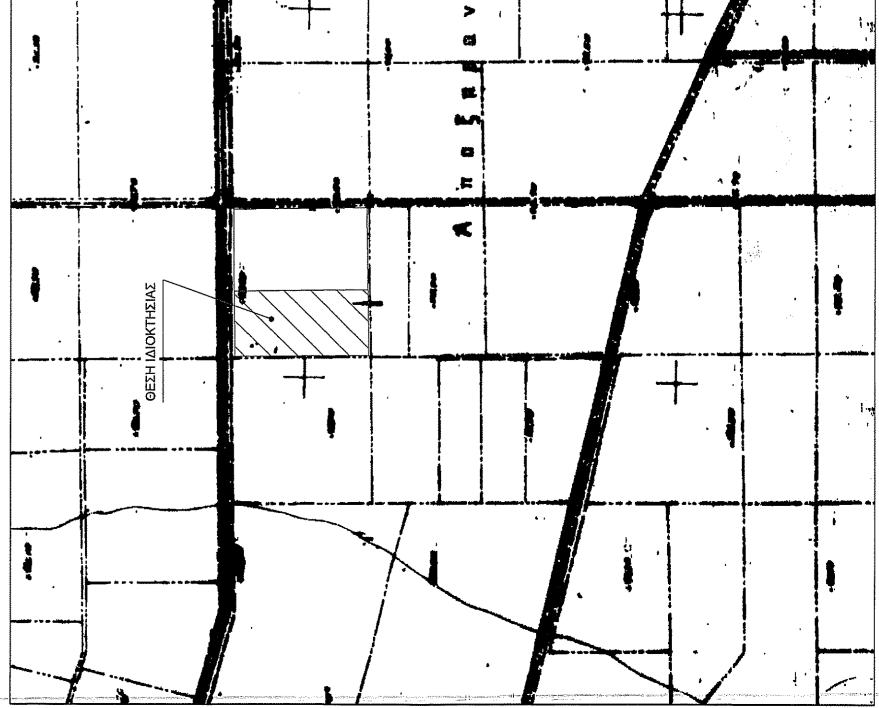
ΑΠΟΣΤΑΣΜΑ ΧΑΡΤΗ ΓΥΣ ΚΛΙΜΑΚΑ 1/5000 ΠΙΝ. 6308 - 5