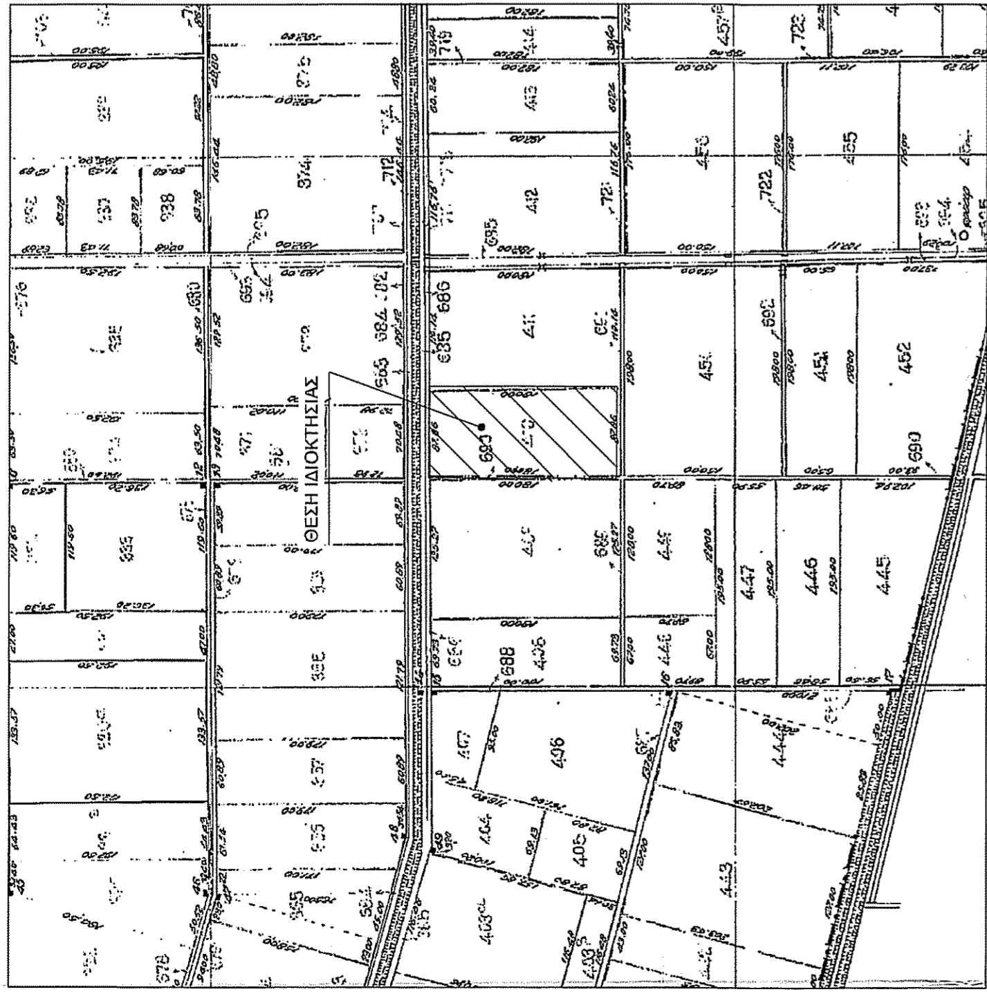
ΑΠΟΣΤΑΣΜΑ ΑΝΑΛΑΣΜΟΥ ΚΑΙ 1/5000