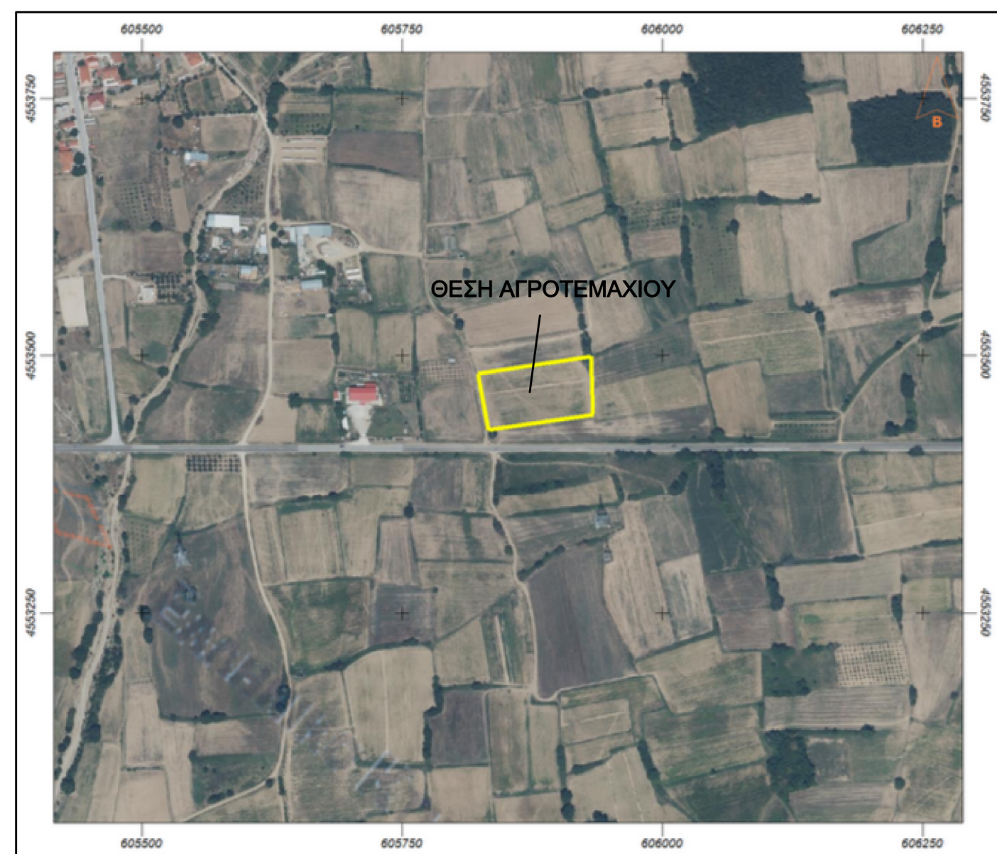
ΔΙΑΓΡΑΜΜΑ ΕΥΡΥΤΕΡΗΣ ΠΕΡΙΟΧΗΣ