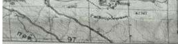
Χάρτης ΓΥΣ κλ. 1:50000_φύλλο "ΔΑΦΝΗ"