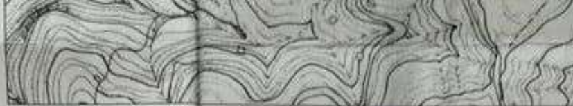
Χάρτης ΓΥΣ κλ. 1:5000_φύλλο 62 59_6