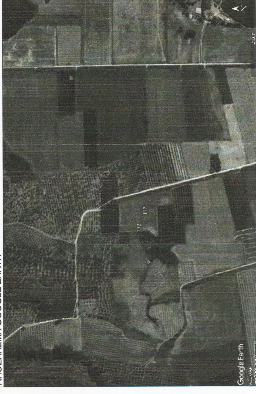
ΑΠΟΣΤΑΣΜΑ GOOGLE EARTH