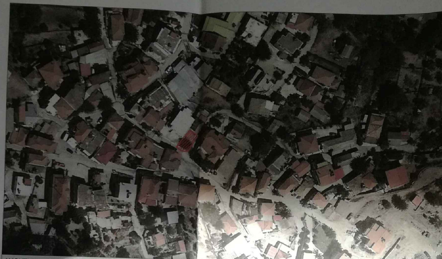
ΙΔΙΟΚΤΗΣΙΑ ΑΠΟΣΤΟΛΟΠΟΥΛΟΥ ΣΠΥΡΟΥ