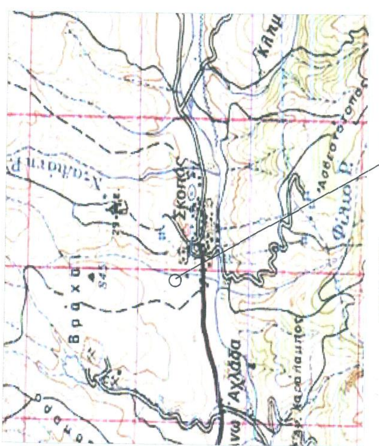
ΚΑΛΙΜΑΚΑ 1:5000 ΘΕΣΗ ΑΓΡΟΥ