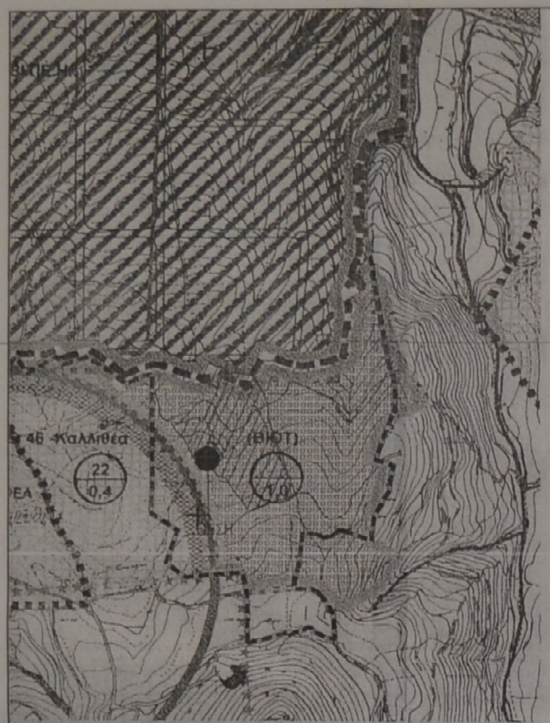
ΑΠΟΣΠΑΣΜΑ ΧΑΡΤΗ ΚΛΙΜΑΚΑ 1:5000