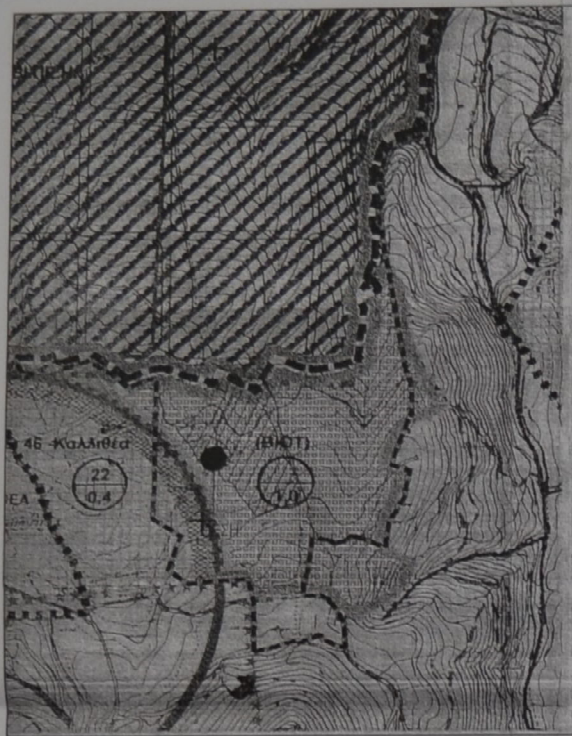
ΑΠΟΣΠΑΣΜΑ ΧΑΡΤΗ ΚΛΙΜΑΚΑ 1:5000