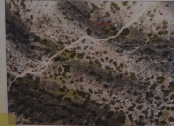
Φωτογραφία 1, ημερίνια λήψης 17 Δεκεμβρίου 2019