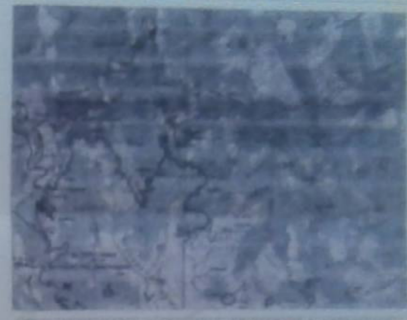
ΑΕΡΙΑ ΑΠΟΤΥΠΩΣΗ ΤΣΙΝΤΟΥΣΙΑΣ ΣΥΝΤΑΞΙΝΟΣ & ΑΝΤΙΣΤΡΩΜΑ ΑΠΟΣΠΑΣΜΑ ΧΑΡΤΗ ΠΕΡΙΟΧΗΣ ΚΑ. 1:50000

Π Ρ Α Σ Η Η παρούσα Πράξη εκδίδεται με σκοπό την καταγραφή των μεταβολών που έχουν γίνει ή γίνονται σχετικά με την ιδιότητα των ορίων των οικοπέδων που περιγράφονται με αριθμ. πρωτοτύπου 14.15.11, σύμφωνα με τις διατάξεις που αφορούν στην παρούσα Πράξη Πράσσεται. Ημερ. έκδοσης: 14/05/2013. Ο Διευθυντής: Δ. Κωνσταντίνου.