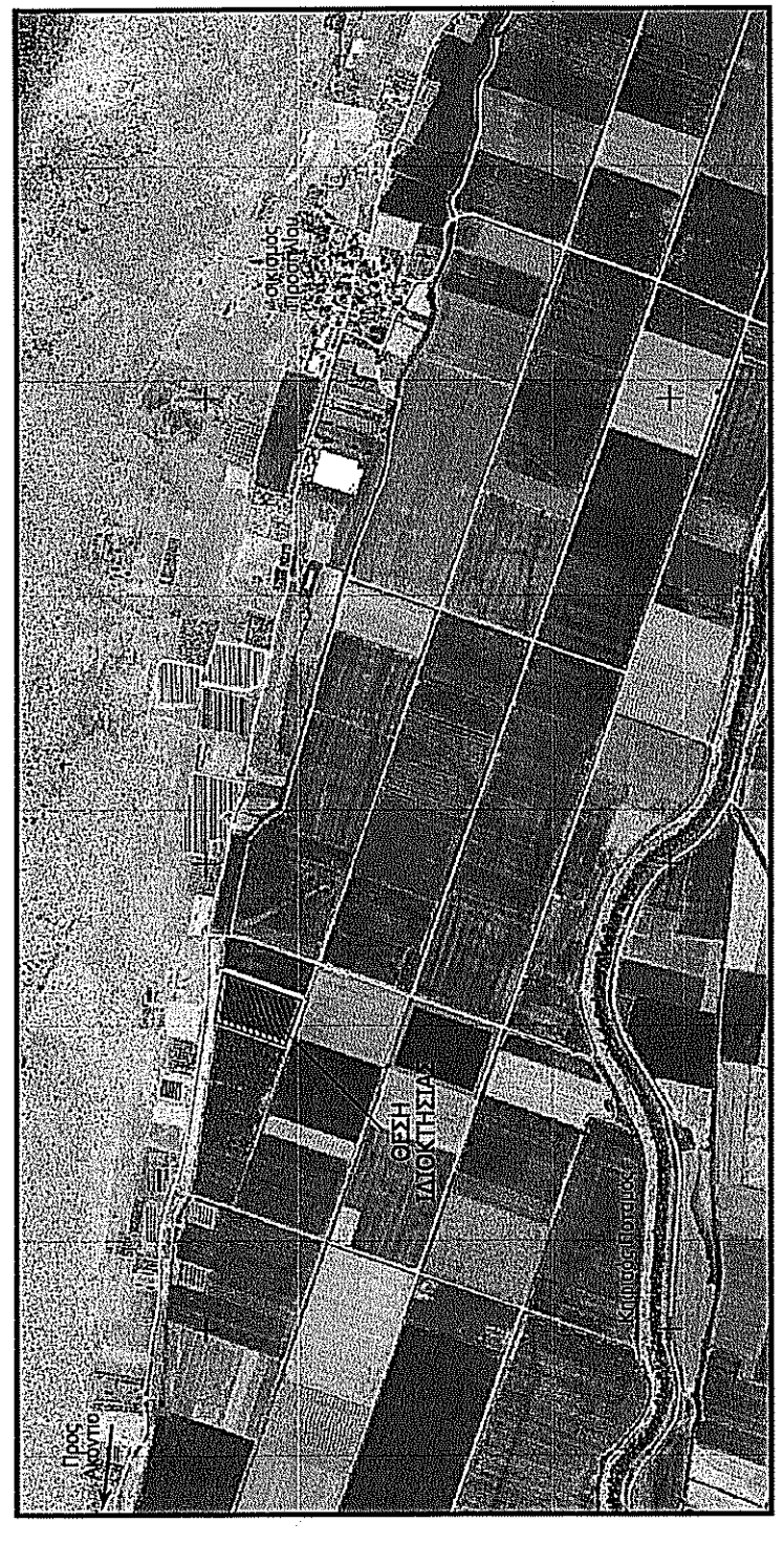
ΑΠΟΣΤΑΣΜΑ ΑΠΟ ΑΕΡΟΦΩΤΟΓΡΑΦΙΑ ΤΗΣ ΚΤΗΜΑΤΟΛΟΓΙΟ Α.Ε.

ΟΡΟΙ ΔΟΜΗΣΗΣ ΕΚΤΟΣ ΟΡΙΩΝ ΟΙΚΤΗΣΙΟΥ (Π.Δ. 24.05.1985 - ΦΕΚ 2700 / 31.05.1985 & Ν. 3212 - ΦΕΚ 3084 / 31.12.2003) Αρμόδια κατά κανόνα: (για πρόσωπο σε κοινόχρηστο δρόμο) Εμβαδόν = 4000μ² - Πρόσωπο = 25.00μ (για πρόσωπο σε Διεθνείς, Εθνικές, Επαρχιακές, Δημοτικές και Κοινοτικές οδούς ως και σε εγκαταλεημένα τμήματά τους και σε σιδηροδρομικές γραμμές) Εμβαδόν = 4000μ² - Πρόσωπο = 45.00μ - Βάθος = 50.00μ Αρμόδια κατά παρέκκλιση: (χωρίς πρόσωπο σε δρόμο) Εμβαδόν = 4000μ² (προ 31.12.2003) (για πρόσωπο σε Διεθνείς, Εθνικές, Επαρχιακές, Δημοτικές και Κοινοτικές οδούς ως και σε εγκαταλεημένα τμήματά τους και σε σιδηροδρομικές γραμμές) Εμβαδόν = 2000μ² - Πρόσωπο = 25.00μ - Βάθος = 40.00μ (προ 17.10.1978) Εμβαδόν = 1200μ² - Πρόσωπο = 20.00μ - Βάθος = 35.00μ (προ 12.09.1964) Εμβαδόν = 750μ² - Πρόσωπο = 10.00μ - Βάθος = 15.00μ (προ 12.11.1962) (εντός της ζώνης πόλεως και οικισμών & προ 24.04.1977) Εμβαδόν = 2000μ²