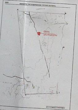
ΑΠΟΙΚΕΣΜΑ ΑΠΟ ΑΡ. 61 ΛΟΔ ΧΑΡΤΗΣ Υ.Σ. 4122/4 4122/4 (Παράρτ. 5) Π.Δ.Σ.Σ. 5/04 (0002922/18-1/08) (Κ.Α. 118/06)