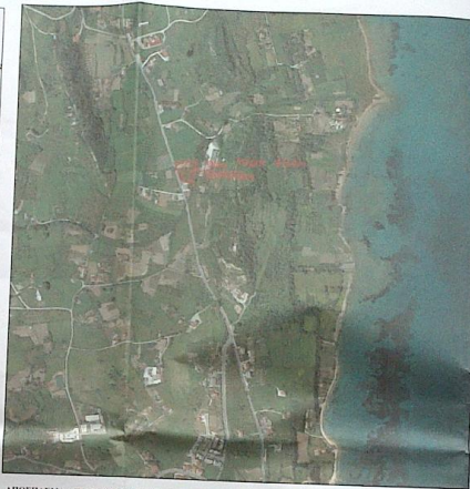
ΑΠΟΙΚΕΣΜΑ ΑΠΟ ΧΑΡΤΗ GOOGLE EARTH (Απόρ. Αρ. 15.100)