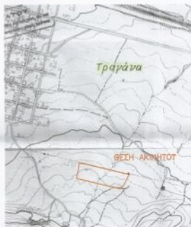
ΑΠΟΣΠΑΣΜΑ ΧΑΡΤΗ Γ.Τ.Σ. ΚΛΙΜΑΚΑ 1:5000

ΠΙΝΑΚΑΣ ΣΥΝΤΕΤΑΓΜΕΝΩΝ ΚΑΤΑ Ε.Γ.Σ.Α. '87 ΚΟΡΥΦΩΝ ΑΓΡΟΤΕΜΑΧΙΟΥ ΒΑΣΕΙ ΤΟΥ Α/Α ΠΡΩΤ. 504/26-06-1992 ΑΠΑΝΤΗΤΙΚΟΥ ΕΓΓΡΑΦΟΥ ΤΟΥ ΔΑΣΑΡΧΕΙΟΥ ΑΤΑΛΑΝΤΗΣ ΕΠΙΦΑΝΕΙΑΣ ΕΜΒΑΔΟΥ 2.621,70 Μ2 (ΜΕ ΤΗΝ ΕΦΑΡΜΟΓΗ ΚΟΡΥΦΩΝ ΕΠΙ ΕΞΑΔΟΥΣ ΣΤΟ ΣΥΣΤΗΜΑ ΕΓΣΑ '87 ΤΟ ΥΠΟ ΣΤΟΙΧΕΙΑ (2,16,17,18,7,15,14,19,20,3,2) ΤΜΗΜΑ "3" ΕΠΙΦΑΝΕΙΑΣ ΕΜΒΑΔΟΥ Ε= 2.593,43 Μ2)