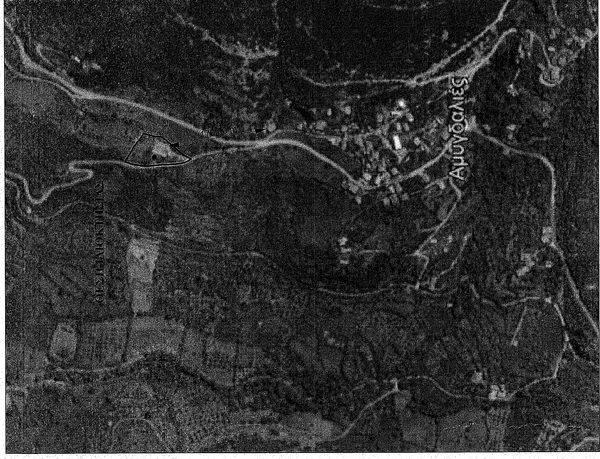
Αεροφωτογρ. Δορυφορικού Χάρτη