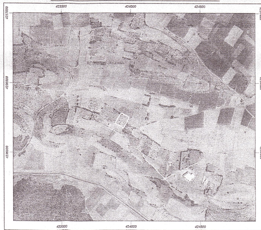
ΑΠΟΣΠΑΣΜΑ Φ.Χ.Γ.Υ.Σ (6329/3) ΚΛΙΜΑΚΑ 1:5000